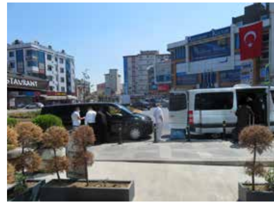
לא מותרים. ביציאה למסע היבשתי

בכל אותו יום שלישי ניסינו למצוא פתח כלשהו להיכנס לרומניה, ואכן קיבלנו כמה הצעות של גורמים שטענו כי באפשרותם לסדר זאת. למעשה העברנו את כל היום בהמתנה מורטת עצבים לרכבים ולתשובות מגורמים שונים וכל זאת לשווא. כך מצאנו עצמנו ללא כל דרך וסיכוי להיכנס לרומניה, לאחר שבזבזנו על