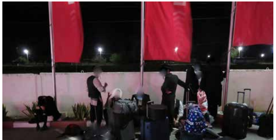
בתחנת הדלק לילה שלם

נוספים שהיו גם הם בדרכם לאומן. בסך הכל היינו 17 איש. בינתיים החלו להגיע השמועות על חסידיים שתקועים באודסה ובקייב ושם מתעללים בהם ומונעים את כניסתם. היו אפילו ידיעות שחלקם הוחזרו לארץ. לבנו החל לפעום בחזקה. חששנו שהכל כבר סגור ותיכף נאלץ לחזור ארצה כלעומת שבאנו.