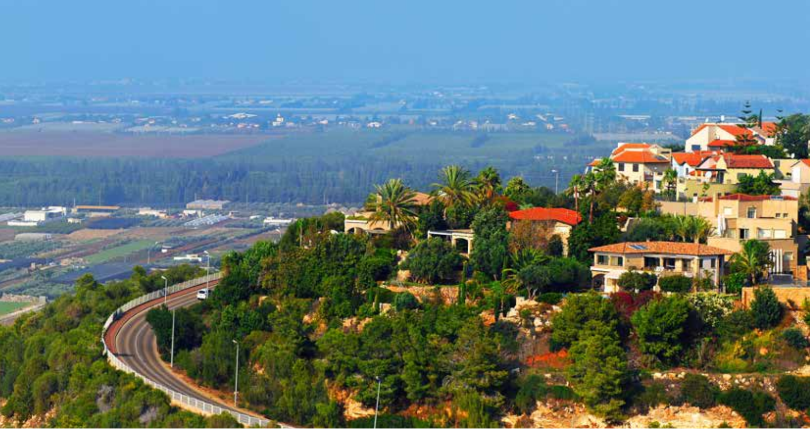
האור מפציע. זכרון יעקב