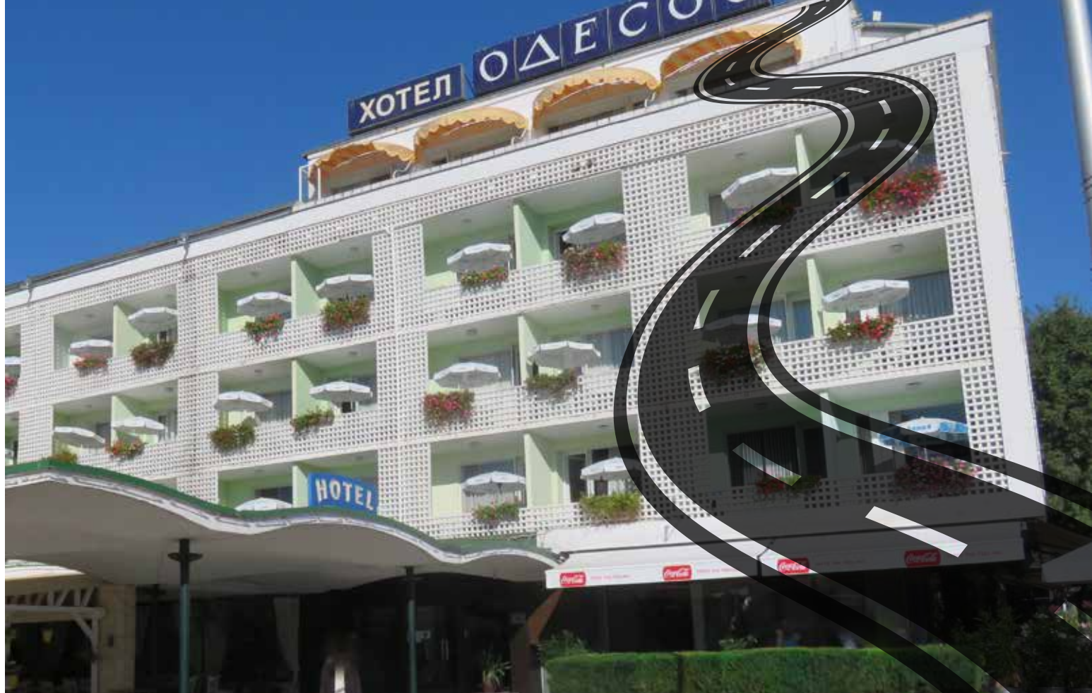
זה לא אודסה... זה רק מלון 'אודסה'

באמרתם הנלבבת של אנ"ש עת קידשו את הירח בחודש אלול: "עם הירח הזה עוד נגיע לאומן"... גם אנו האמנו שבעזרת ה', עם הירח הזה נזכה להגיע.