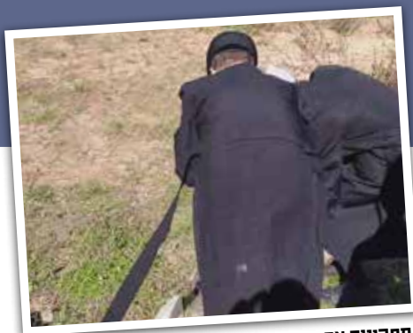
מתקינים את העירוב

1,196 אנשים ששהו במקום בו זמנית, כל זאת מבלי שיהיה אישור מהצד האוקראיני להכניס אותם. המהלך גרם לחץ גדול על האוקראינים, שכמעט נשברו, אבל מעשה שטן הצליח והישועה המיוחלת לא הגיעה.