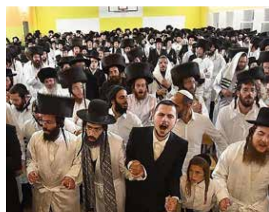
ערב ראש השנה במינסק