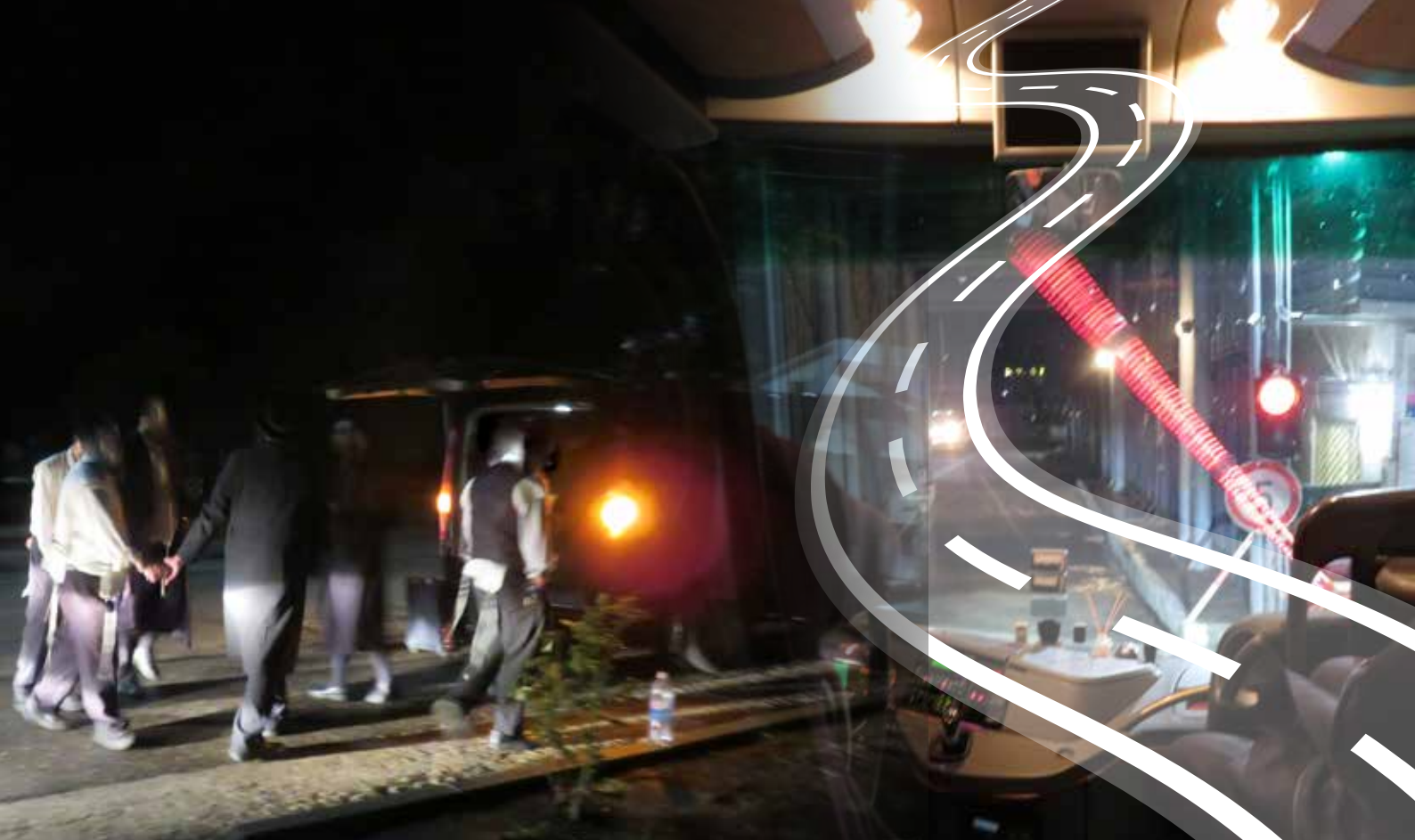
הריקוד האחרון על אדמת מולדובה