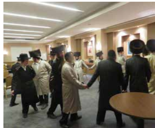
פתח לנו שער. ריקודים במוצאי שבת במלון באיסטנבול

בצהרי יום שישי חברנו לקבוצה נוספת שהגיעה מהארץ, ובה בין השאר הרב י.צ. ועוד עשרה חברים יקרים. כך הפכנו לקבוצה בת 13 איש, נחושים וחדורי אמונה ותקווה שנוכל להגיע