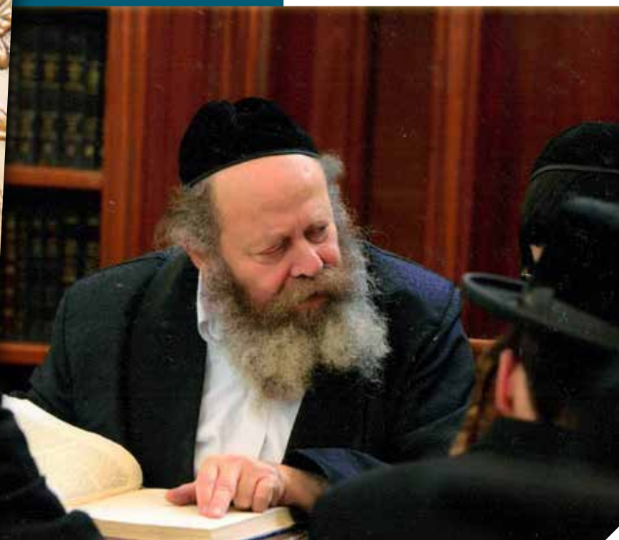
בעיון גדול. במסירת שיעור בעיון בתורה הזמנית בכלל חצות