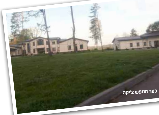
פנר הנופש צי"קה

קהילת קודש פינסק היא תופעה ייחודית בבלארוס ואולי בכל העולם, כאשר כל בני