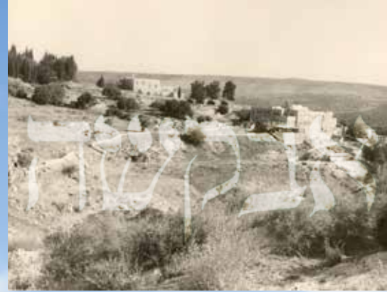
מירון בימים ההם

בספרו "ימי שמואל" מתאר רבי שמואל הורביץ ברגשי קודש את עבודתם את בוראם בצוותא בציון הרשב"י ומאוחר יותר בירושלים העתיקה, כשהדגש מונח על אהבת החברים המופלאה ששררה ביניהם. "...ובפרט אני ורבי אלטר בן ציון ויעקב זאב ורבי ישראל