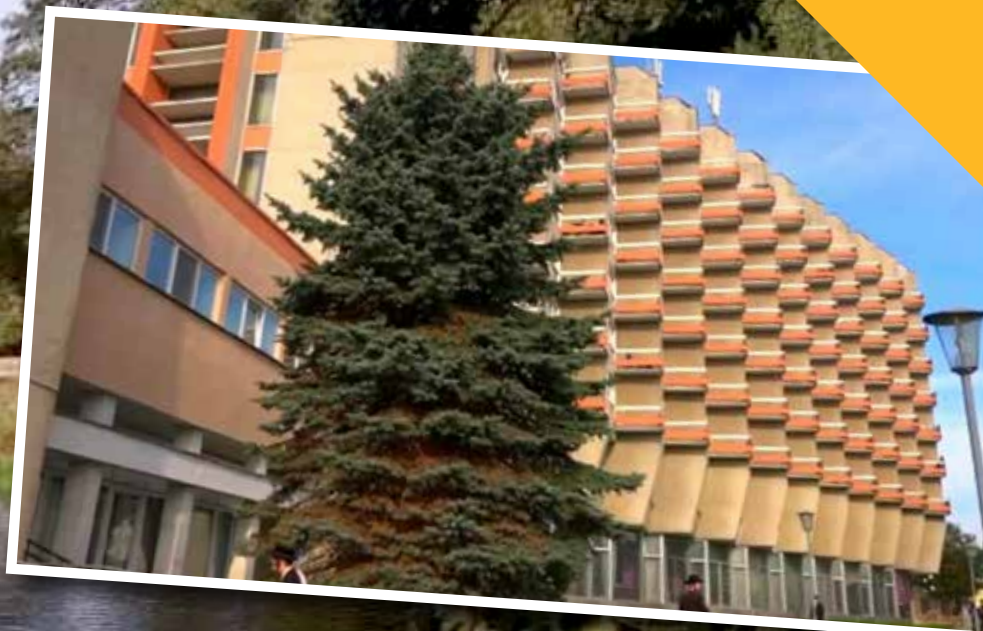
מלון אנדריי בפּינסק בו התקיים הקיבוץ בראש השנה ברקע: כפר חמים ומסביר פנים. נוף של נחל בצייקה