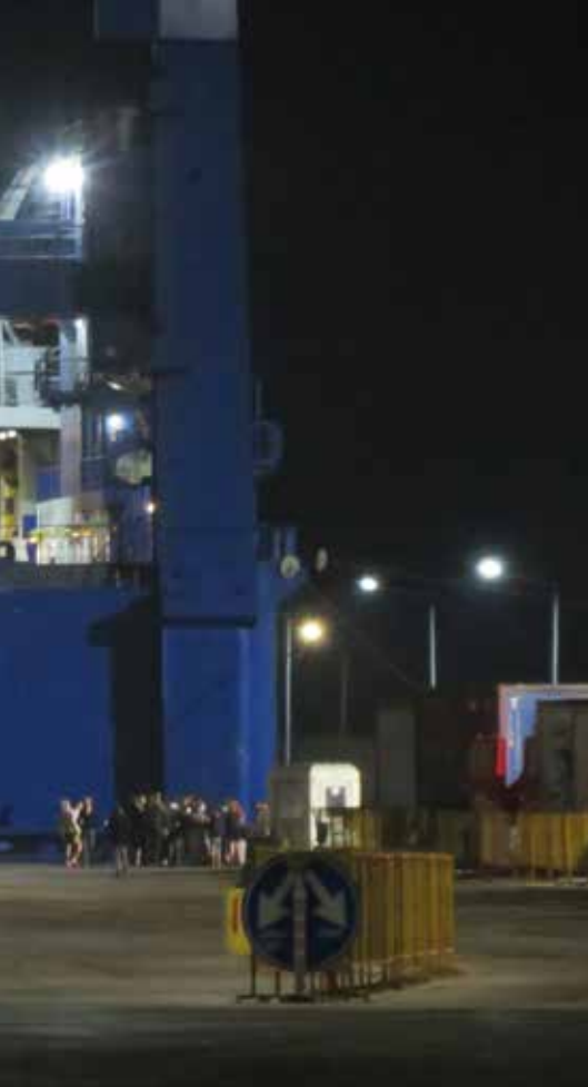
המעבורת מעבר לשערים הנועלים

המתנה מורטת עצבים האונייה הפליגה לדרכה והבנו שהאופציה הזו נסגרה גם היא בפנינו.