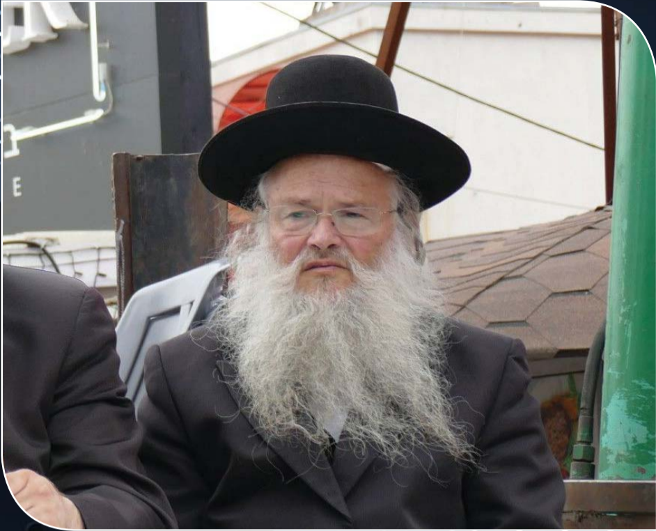
הגה"ח רבי שמעון טייכער