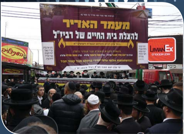
בעת קבלת עול מלכות שמים