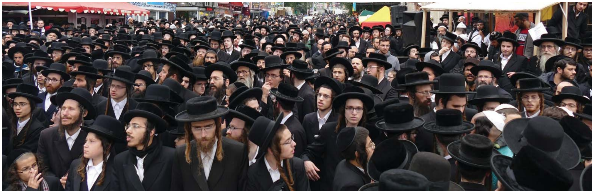
חלק מקהל האלפים בכיכר פושקינה

מי היה מאמין שנגיע למצב שכזה, שדווקא אלו המכנים עצמם "חסידי ברסלב" והמתיימרים לצעוד בדרכיו, הם המה אשר בשאט נפש יפגעו במקום הקדוש הזה, והכל תמורת עסקי גדל"ן וגריפת הון, ו/או כביכול "לשם שמים" לבניית בתי כנסיות, מקוואות וכדומה, אשר על כגון דא זועק הנביא (ישעיה א, יב-יג): "כי תבאו לראות פני מי בקש זאת מידכם רמס חצרי. לא תוסיפו הביא מנחת שוא, קטרת תועבה היא לי".