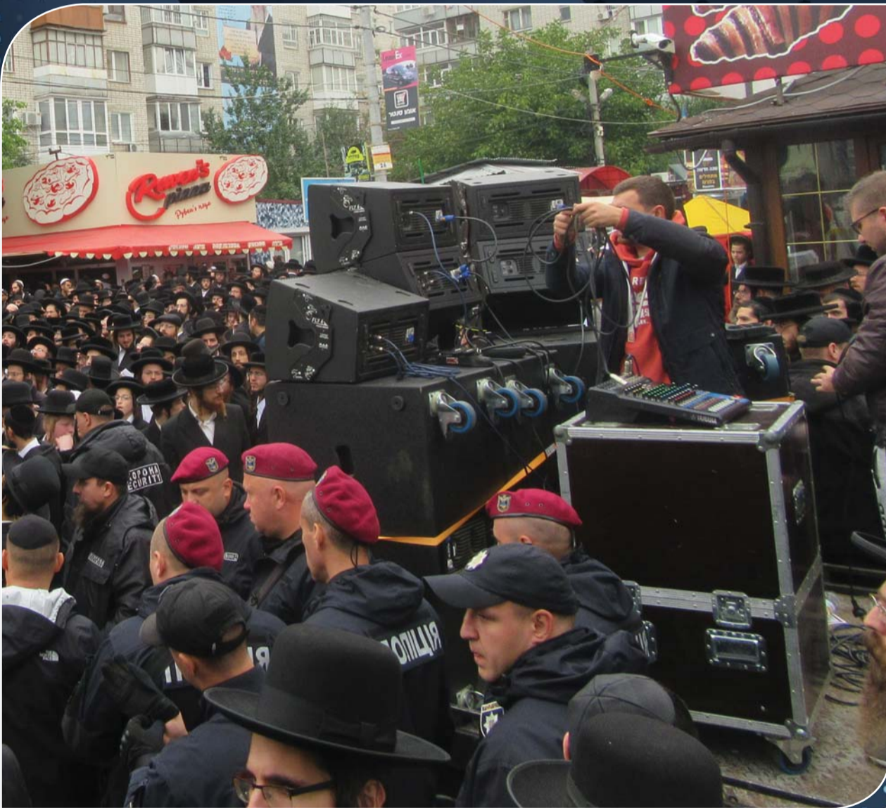
לאחר חבלות במערכת ההגברה, מנסים הטכנאים להתגבר על התקלות