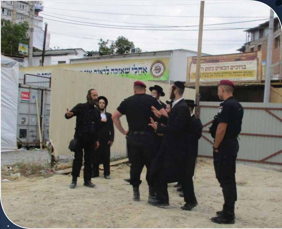
המפיונר הנודע מונע ממוסרי הנפש למחות בפשע - ער"ה תשע"ז