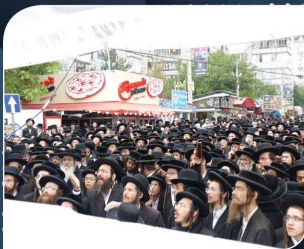
כאיש אחד בלב אחד - ציבור האלפים במעמד