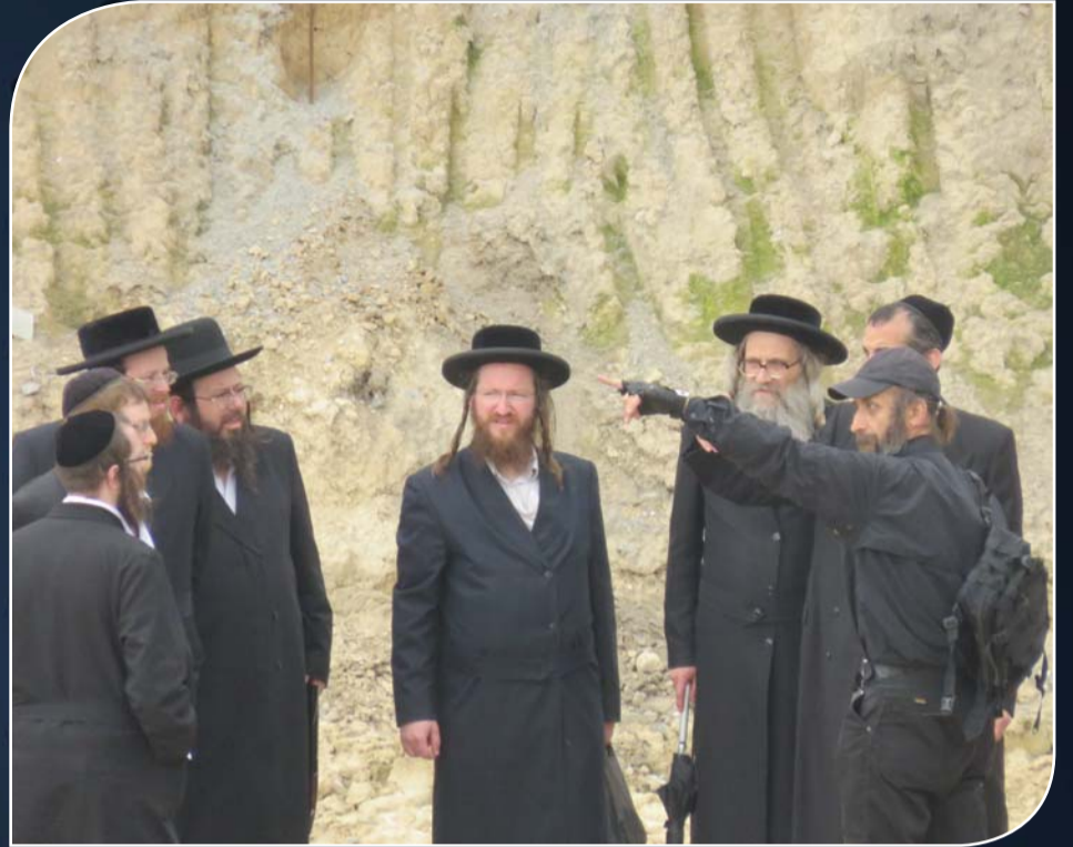
המפיונר הנודע שלווחו של מחלל הקברים מגרש את הרבנים - אייר תשע"ז