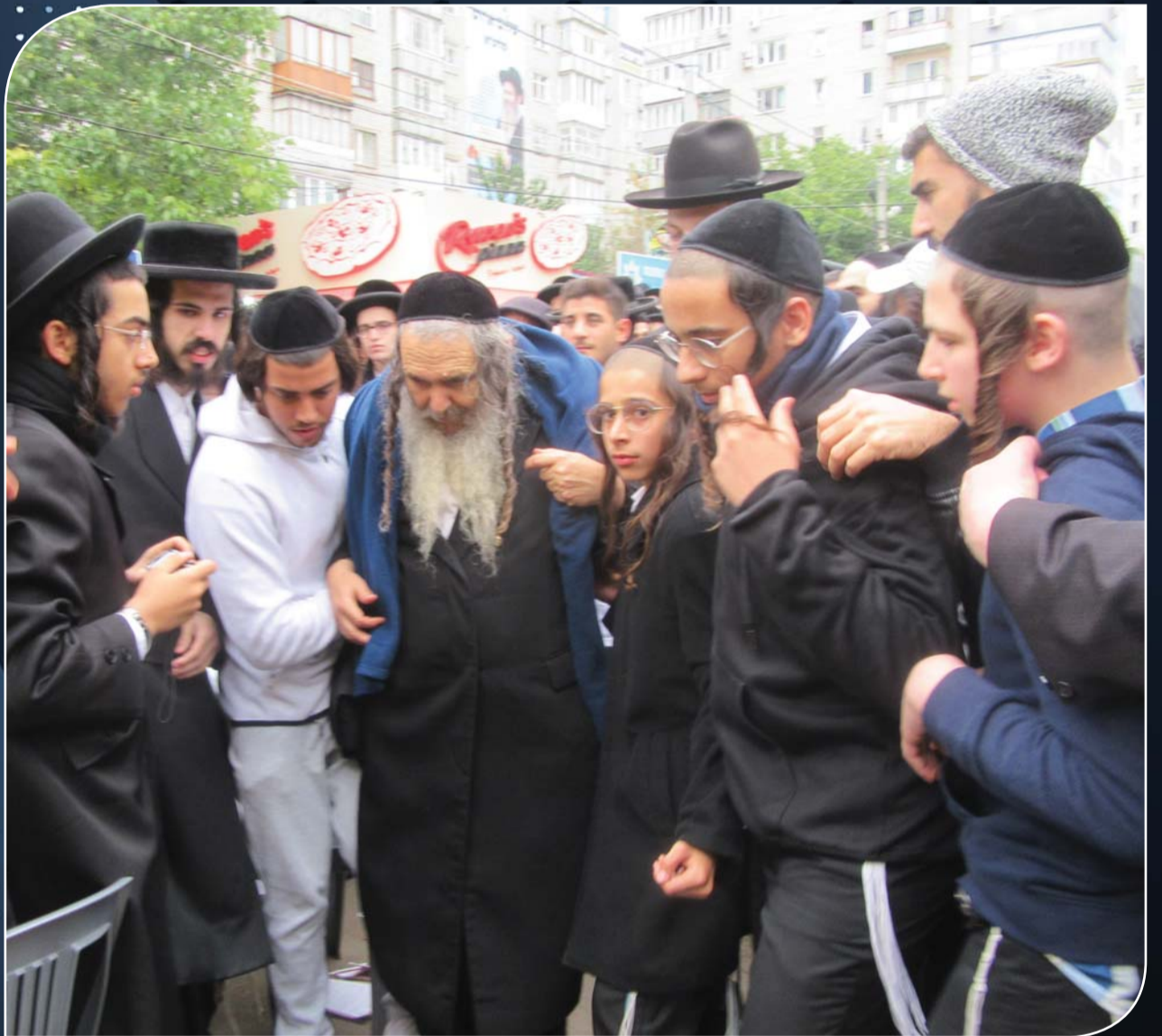
הגה"ח רבי שלום ארוש מגיע למעמד