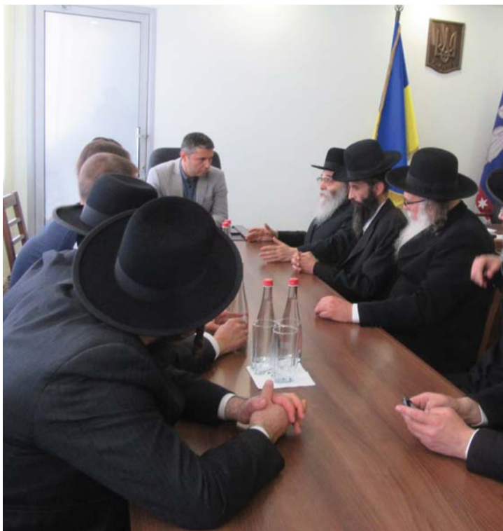
פגישת העסקנים שליט"א שלוחי מנהיגי ברסלב עם ראש עיריית אומן

כפי שפורסם בשבועות שלפני ראש השנה בריכוזי חסידות ברסלב על קיום מעמד אדיר והיסטורי בראשות הרבנים הגה"צ מנהיגי חסידי ברסלב שליט"א, התקיים באומן מעמד אדיר ורב רושם,