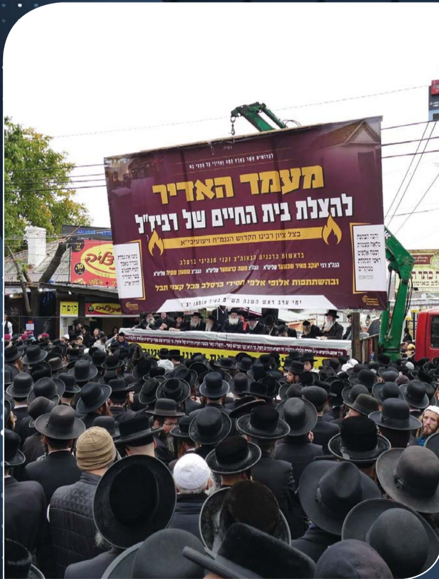
בימת הכבוד וחלק מקהל המזוונים