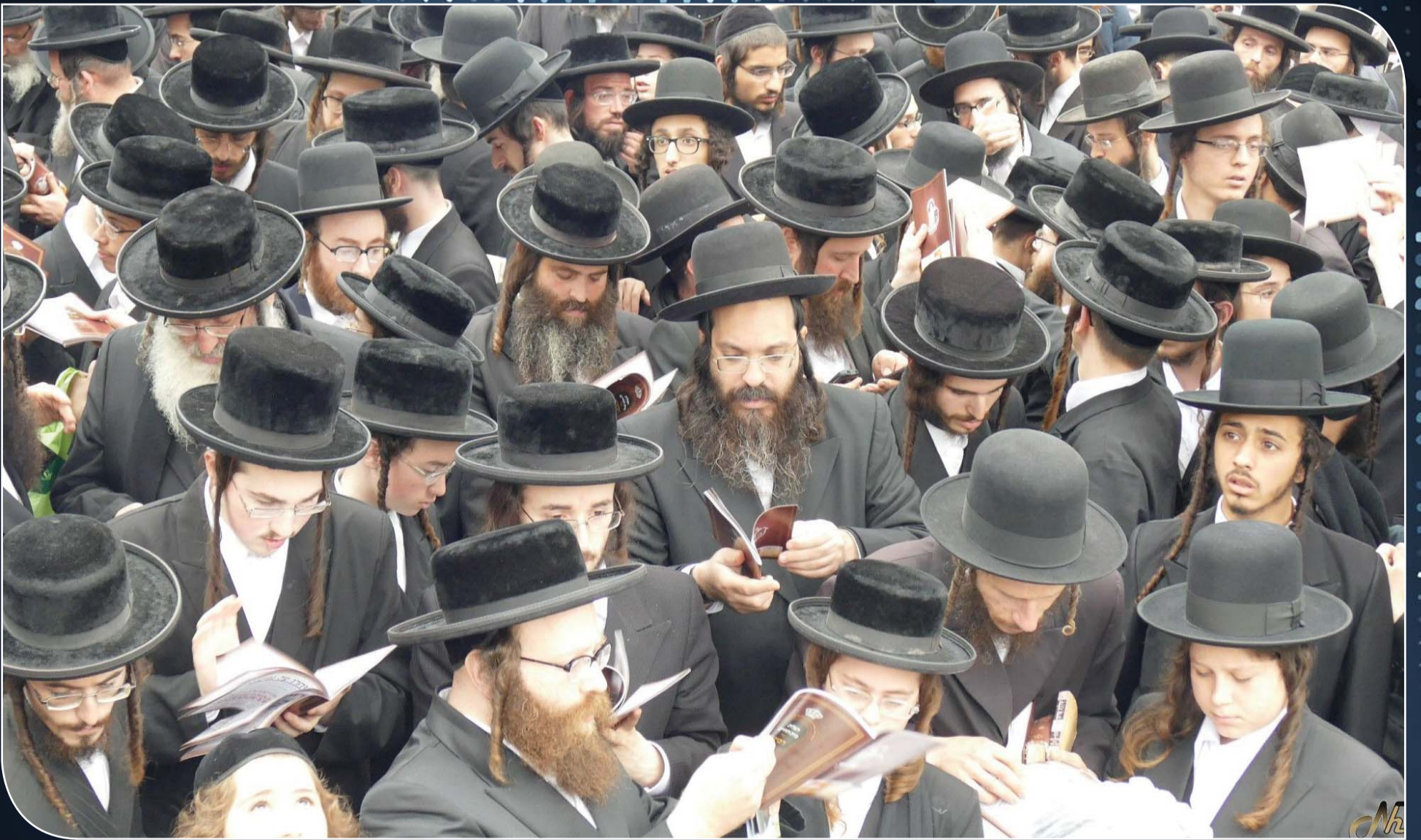
וכל הנותן יד עליהם... אותה יד תק... - קהל ההמונים בתפילת הגר"ח פלאג'י