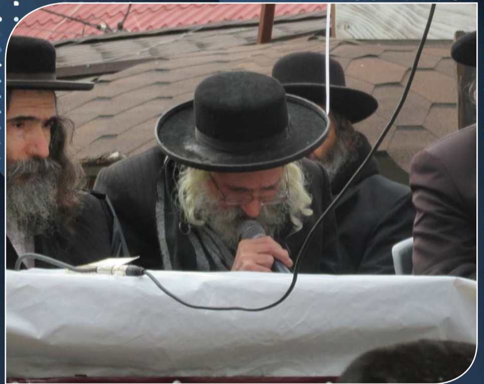
הגה"צ הר"ש שפירא: "פגיעה בבית החיים היא פגיעה ברבינו עצמו!!!"