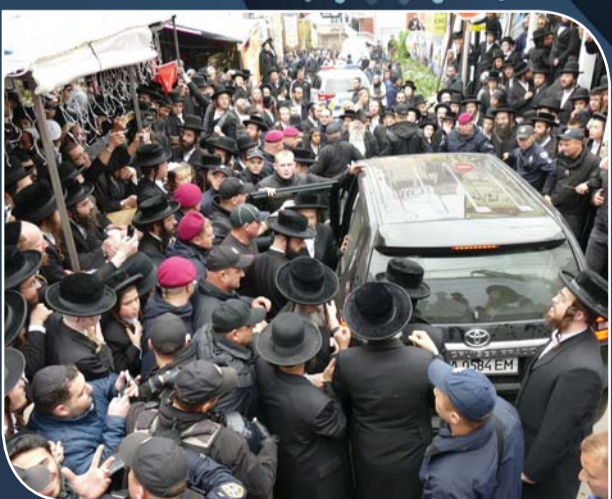
הגאון"צ הר"מ מגיע למעמד