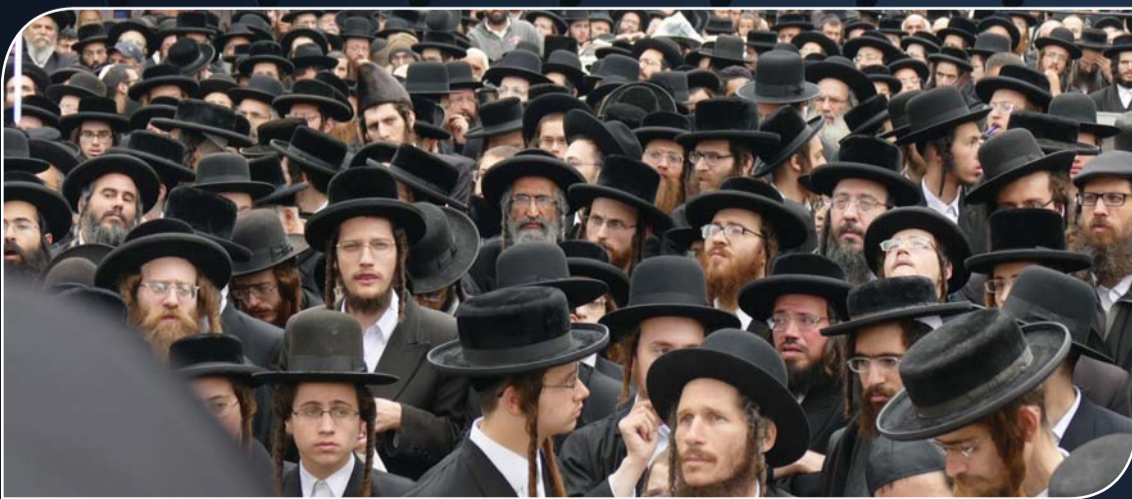
האלפים שותים בצמא את דברי הרבנים שליט"א