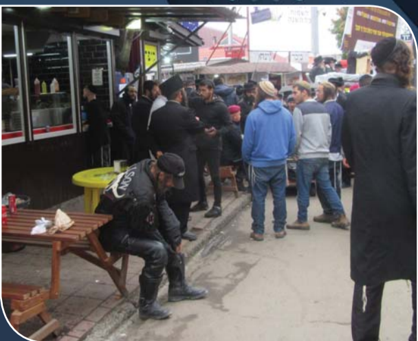
המה כרעו ונפלו - המפיונר המותש