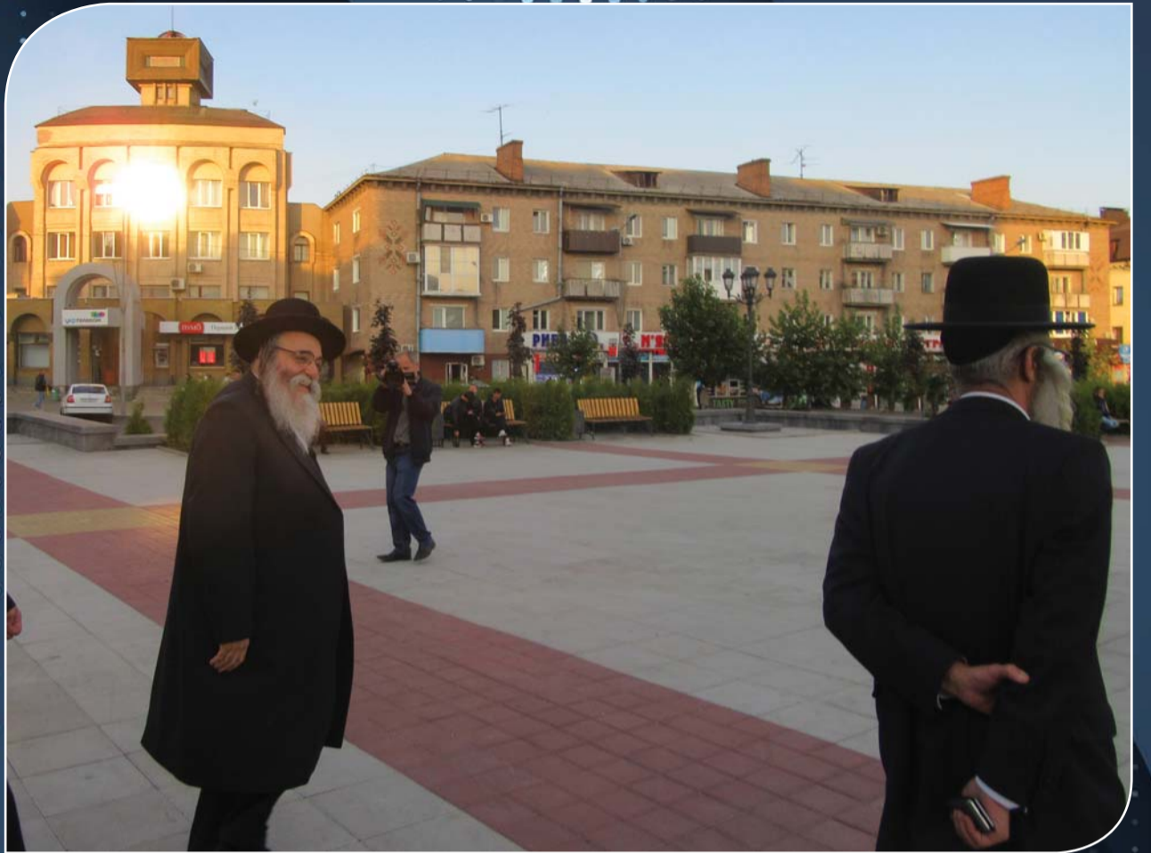
העסקנים החשובים יחדיו עם הרב נידערמאן והנגיד הנודע הרב סטראלאוויטש בסבב פגישות - (מסוקרים ע"י הרשויות)