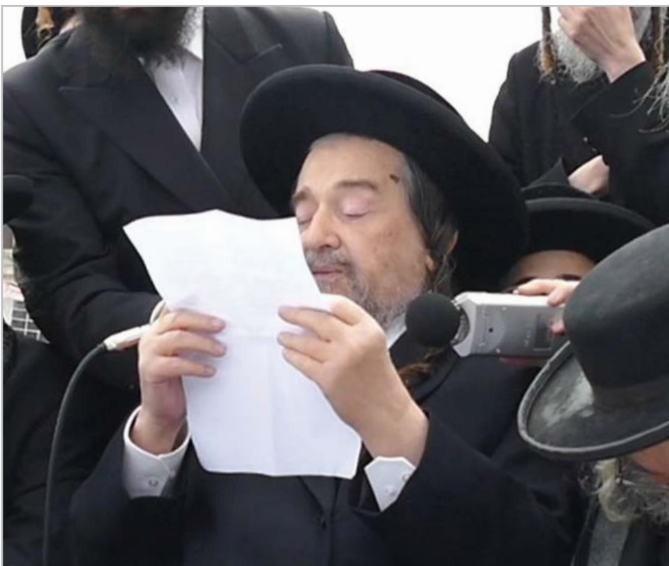
הגרי"מ שכתער נושא דברים

סמוך חומר צהוב סמיך על הציבור הקדוש, לשיא הגיעה עזותם הנבזית כשהם שולחים את אותם נערי שוליים לסנוור את עיני העדה הגה"צ שליט"א שישבו על בימת הכבוד, ב'לייזר' עוצמתי.