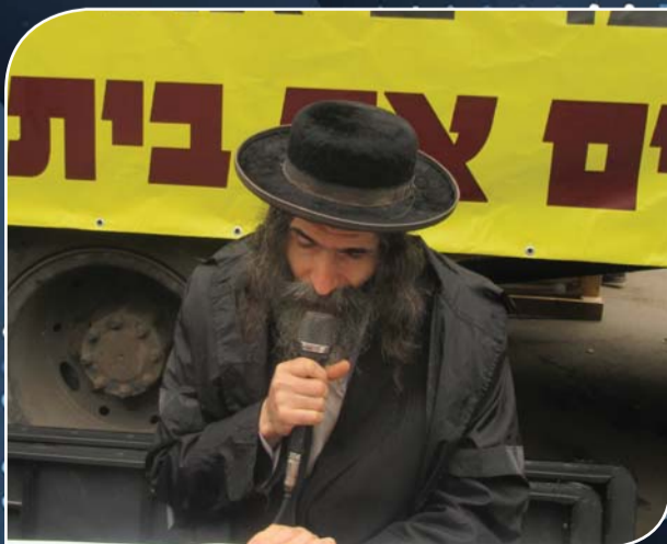
הגה"ח ר"נ שפירא בפרקי תהלים