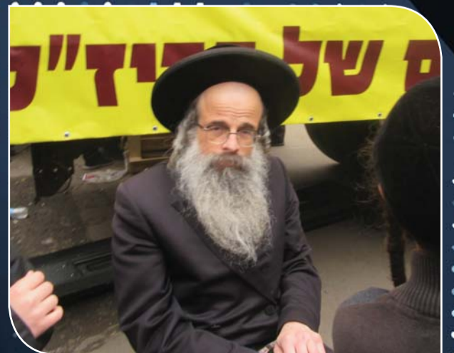
הגה"ח ר"ש כהנא