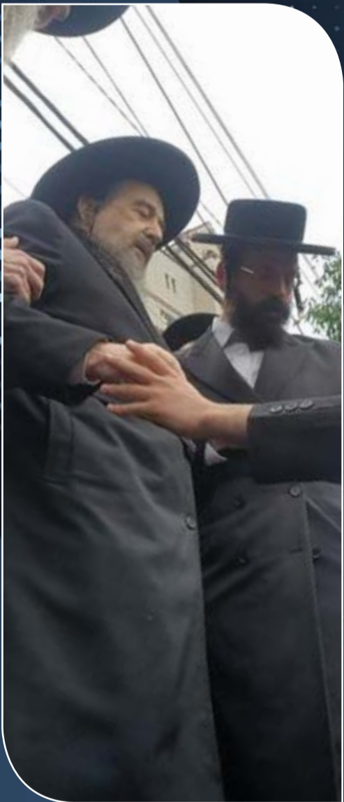
הגאון"צ הר"מ מגיע למעמד