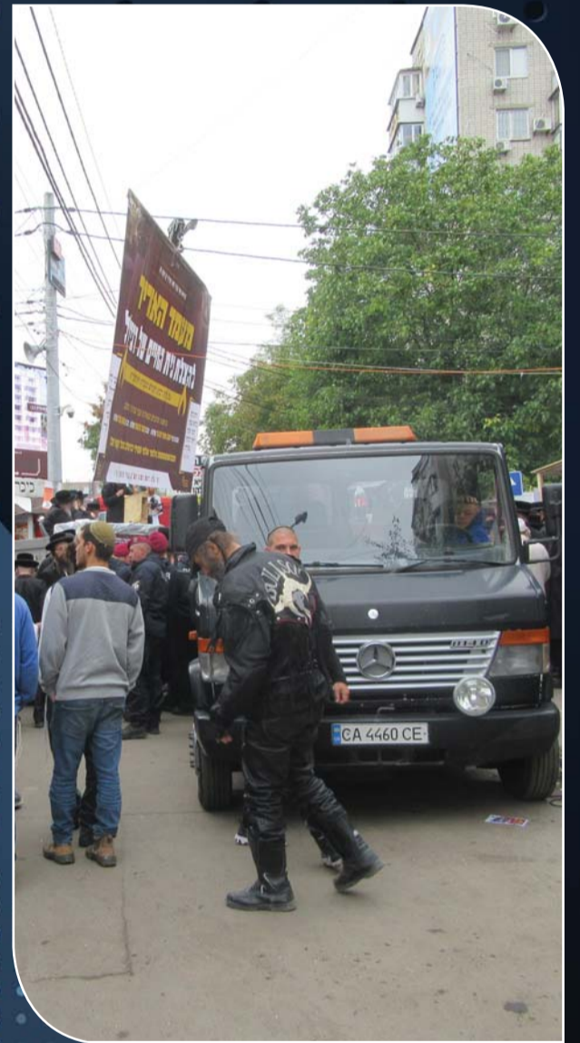
אותו מפיונר בנסיונותו לחבל במעמד