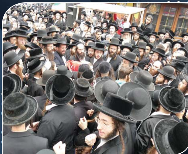
שלוחי המחללים מתנכלים לציבור ההמונים