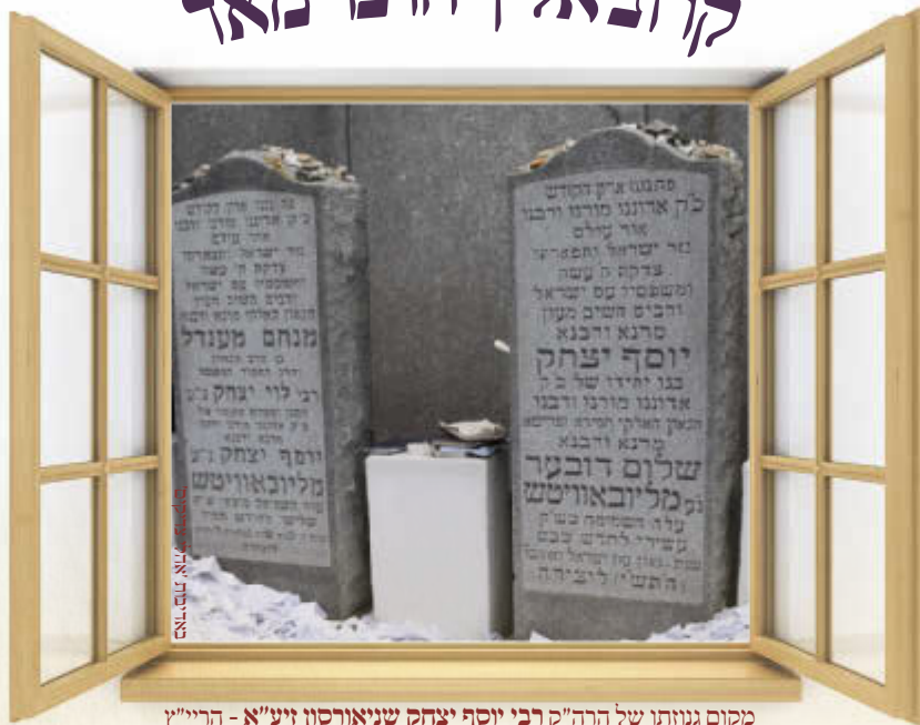
מקום גנותו של הרה"ק רבי יוסף יצחק שניאורסון זיע"א - הרייזין