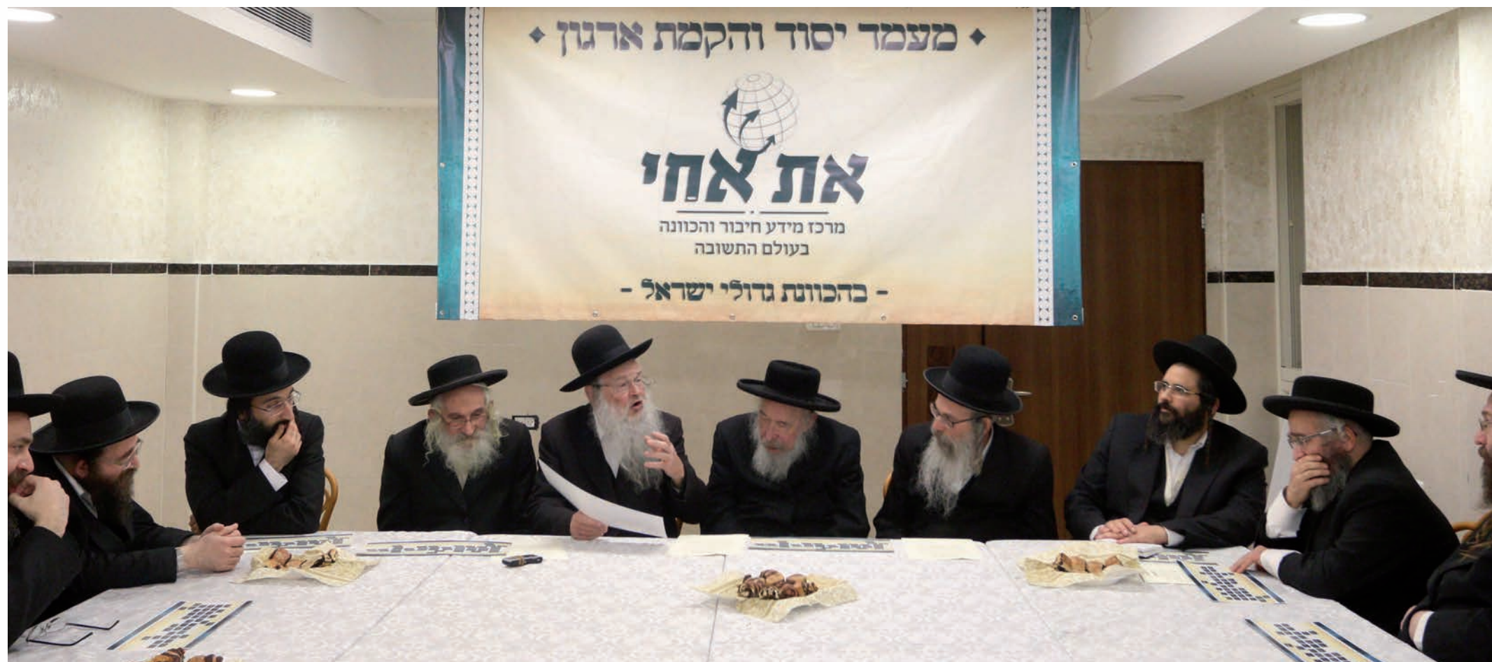
כנס היסוד של 'את אחי' בעיירה ירושלים ת"ו