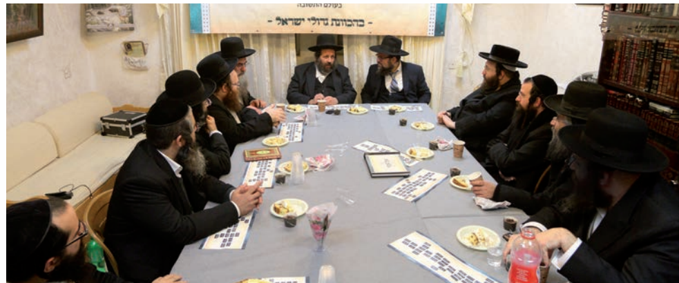
כנס המשך בהשתתפות אישים חשובים מעולם התשובה