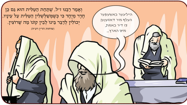
נאמר רבנו ז"ל, שמתח השלית הוא גם כן חדר מיוחד כי כשמשלשלין השלית על ענינו, יכולין לדבר בינו לבין קונו מה שרצוין. (שבתת הרי"ו ע"ה)

טייערע לעכטיגע קינדער, איז ענק אמאל בייגעפאלן די פראגע, "פאַרוואס הייבט מען אלעמאל אן צו זאגן סליחות ביי די אשפנזים דווקא פון מוצאי שבת?" וואס האט שייכות שבת צו סליחות?