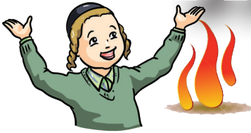
אייערע קינדער זאלט איר מודיע זיין וואס דא האט זיך גיטאן (שיה"ר ורט)