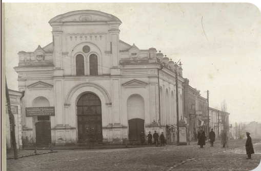
שטאטישע שול אין בארדיטשוב

ר' שמואל העשיל איז נאך עטליכע יאר געגאנגען וואוינען אין שטאט יפו. ווינטער תרע"ד איז ר' שמשון דארט געקומען מיט זיין זון שמחה, ווען