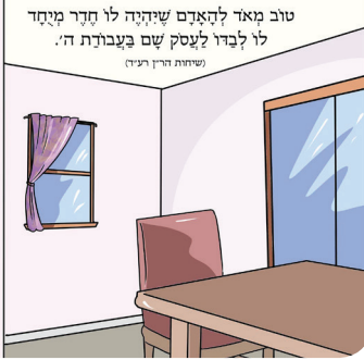
טוב מאד להאמין שיהיה לו חזר מחזק לו לבדו לעסק שם בעבודת ה'. (שמות ה"ד ר"ד)

בייגט זיך נישט אהער אדער אהין, עס שטייט פונקט אינמיטן, אזוי אויך דארף א איד שטיין אין עבודת ה'. פון איין זייט דארף מען זיך האלטן גאר קליין און נישט האלטן פון זיך גארנישט, אבער פון דער צווייטער זייט דארף מען האבן אסאך עזות דקדושה און זיך נישט לאזן אראפוארפן פון קיין שום שטער.