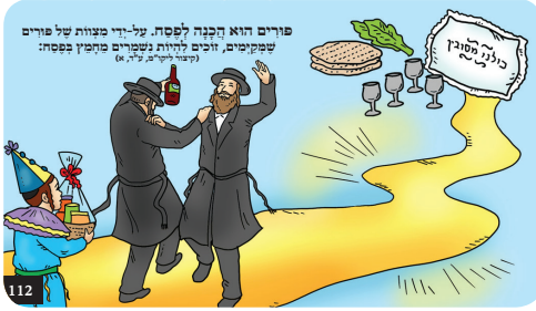
פורים הוא הכנה לפסח. על-ידי מצוות של פורים שפוקמים, זוכים להיות נשקרים פסחין בפסח: (דברי חיים"ם ע"ה, א)

השם יתברך זאל זיך שוין מרחם זיין אויף כלל ישראל ובפרט אויף די אידן אין אוקריינע, עס