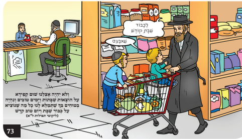
ולא יורה אצילי שום שקידא על רוצאות שבתות וימים טובים ונהיה מטויים בך שחמלא על כל פנינו שובאי על כבודי שבת ימים טובים קורים (ליקוטי תהלים "א")

און דער רבי האט טאקע מרמז געווען אז היינט דארף מען מגלה זיין פאר אלעמען די צען קאפיטלעך תהלים מיט'ן צוזאג פון הייליגן רבי'ן. און היינט דארף מען דערציילן די מעשה - וואס מיר, קינדער, האלטן טאקע יעצט אינמיטן לערענן - די וואונדערליכע מעשה פון די זיבן בעטלערס'. וואו דער רבי פארציילט צום סוף פון די מעשה אז עס איז פארהאן צען ערליי נגונים, און דער בעטלער אן די הענט היילט די