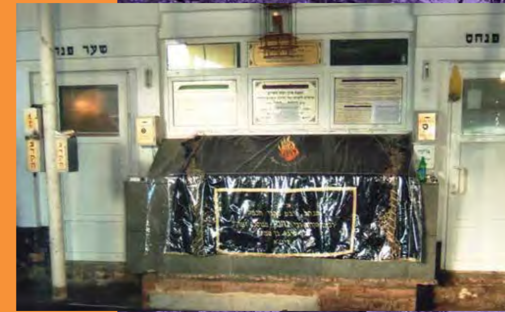
הציון בעת השיפוץ סניף תשס"ז רואים את המצבה החדשה והישנה ביחד

בחסדי שמים נמצא מקום לפנימייה במקלט בניין מגורים עם תשתיות לא ראויות המקשים על שנתם הקצרה של בחורי הישיבה, ספרי תורה שרויים בצער!