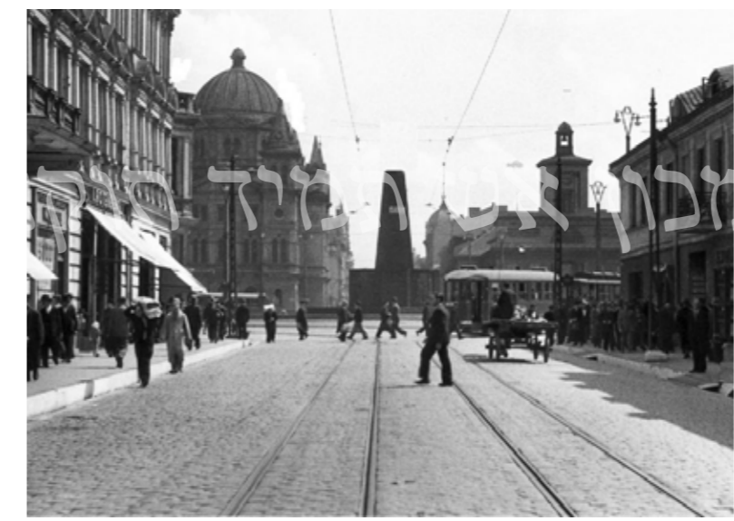
לודז' שלפני המלחמה

בשנים האחרונות טרם עלות הכורת הנאצי על שמי אירופה בה נשמדו והוכרתו מיליונים רבים מבני עמנו היו אלו ימי שיא פריחתה ושגשוגה של חסידות ברסלב בפולין, אין די עט ודיו שיוכלו תאר את בית היוצר שרחש שם, הכל התחיל מנר קטן שעד מהרה הפך לעשרות אבוקות לוחטות באש בוערת זיקוקין דנורא כלהט הקדושה בעבודתם ועשייתם.