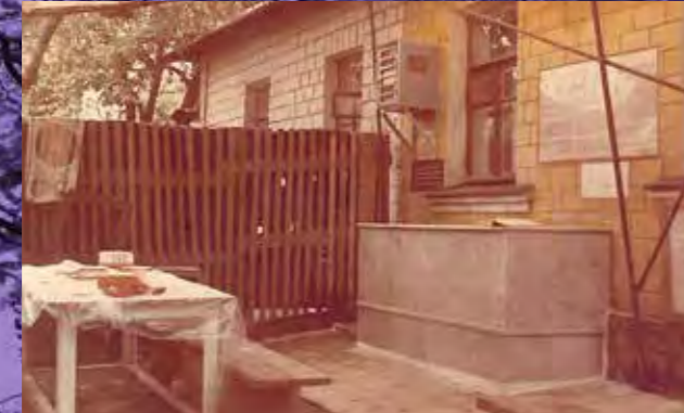
ציון רבינו הישן