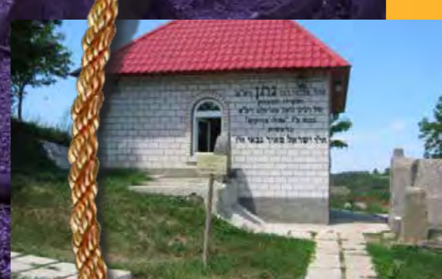
הציין לפני המלחמה