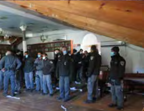
הפשיטה של המשטרה על הישיבה