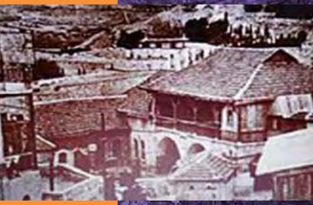
בתי מחסה בשנת תש"ח