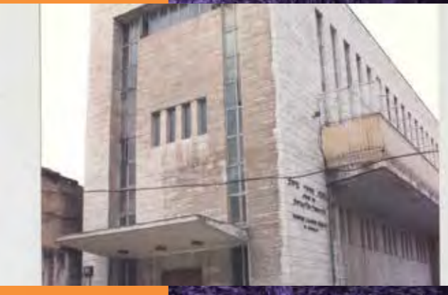
השוה"ל הגדול דחסידי ברסלב