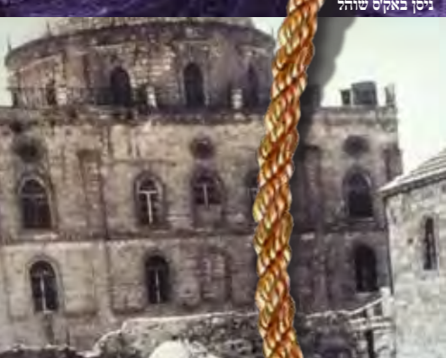
גיסן באקס'ס שוהל