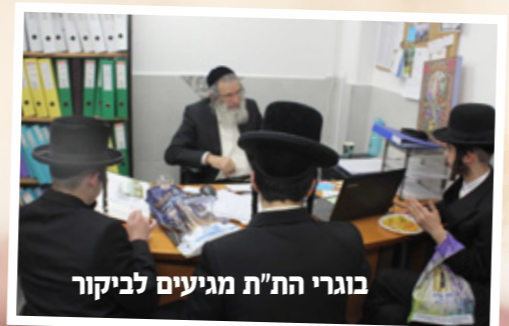
בוגרי הת"ת מגיעים לביקור