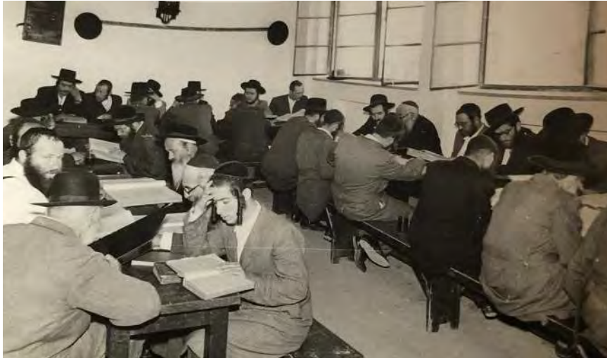
סדר לימוד בישיבת אור הנעלם