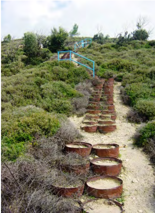
כאן זחל רבינו הקדוש על ידיו ורגליו