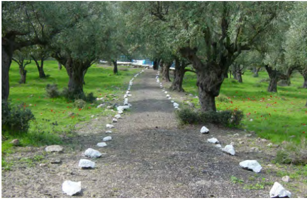
מטע הזיתים באופק נראה קבר ר"י סארגוסי