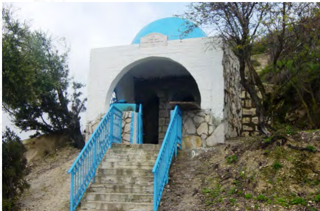
הבנין על מערת רבי כרוספדאי

סלע ועץ בטנים ואצלו מערה אחת גבוהה וגדולה מן הנזכר בכפליים, מיוחסת לרבי כרוספדאי ז"ל הנזכר בתיקונים".