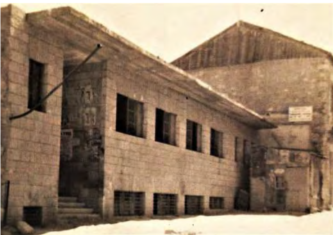
הבית בהיבנותו - החלק הראשון (היכן שנמצא היום היכל ה"כולל")