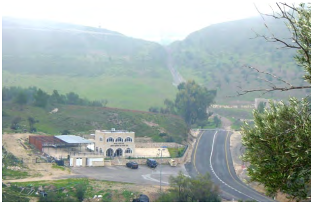
קבר רבי יהודה בר אילעאי כפי שנשקף מראש ההר של רבי כרוספדאי