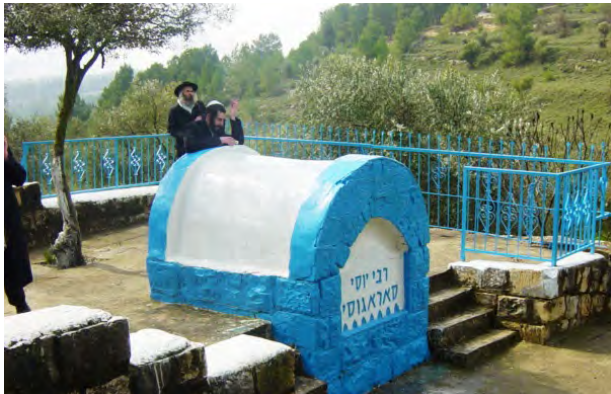
קבר הצדיק הלבן