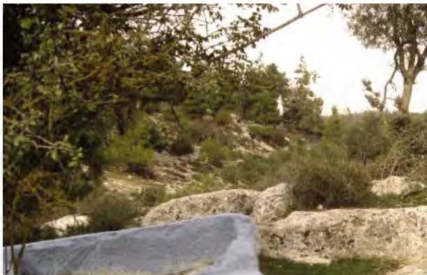
קבר ר"י הלבן מבעלי התוספות לפי אהלי צדיקים