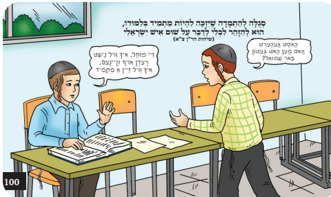
פולה להתפלה שזכה להיות מתמיד בלמודו, הוא לזהיר לבדי לדבר על שום איש ישראל (סיפור מ"ן י"א)

טייטש דער רבי: "ואתחנן אל השם תמיד, איך דאווען צום אייבערשטן אלעמאל, סיי צו איך האב דבקות, סיי אן דבקות. בעת ההיא לאמר, אין יענע צייט ווען איך