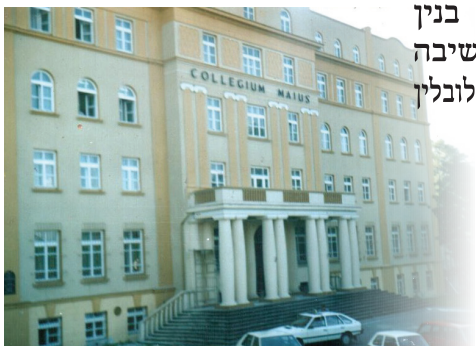
בנין הישיבה אין לובלין

מען האט געזען אז עס איז געווען אַ גרויסע התעוררות, אַ גרויסע התלהבות אין לובלין, האט מען דעמאלט אָפּגעפֿסק'נט אז אַלע 'איש לא יעד'ר זאל פֿאָרן ראש השנה קיין לובלין! דאָרטו זענען געווען אַלע צוזאָמען און מען איז געגאנגען צוזאָמען צום ציון פון הייליגן חוזה! דער חוזה האט דאך געהאט אַ נאנטשאפט מיטן רבי'ן, ער האט געגעבן און הסכמה אויפֿן ספר לקוטי מוהר"ן, וועט מען דאָרט זאָגן די צעו קאפיטלעך תהלים, און זיך משתטח זיין אויף זיין ציון, און אזוי איז טאקע געווען.