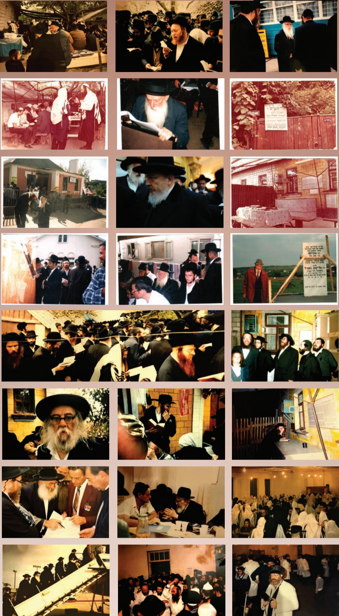
הוא מופץ בכרטיז הארץ