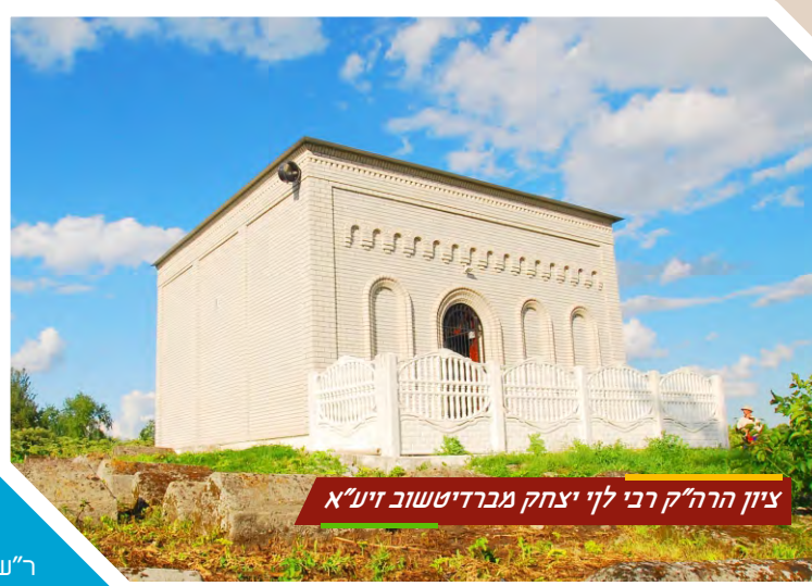
ציון הרה"ק רבי לוי יצחק מברדיטשוב זי"ע

הקב"ה מנהל את כל העולם מהחיה הכי גדולה ועד התולעת הכי קטנה אינם יכולים לעשות דבר נגד רצונו ית', רק לאדם נתן הקב"ה כח בחירה, והקב"ה יושב ומצפה לראות את בחירתו. האם נצא למלחמה על האויב? האם נעשה כל שביכולתנו למחות את זכר עמלק?