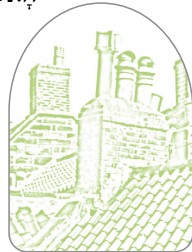
קוימען אויף די דעכער