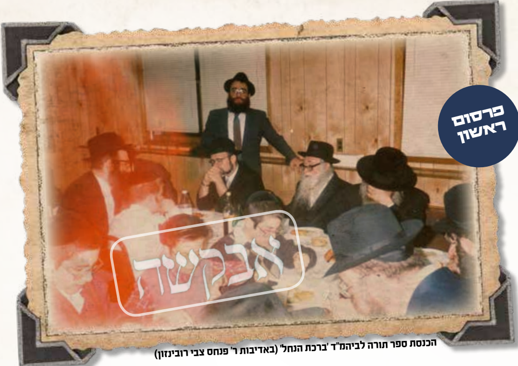
הכנסת ספר תורה לביהמ"ד 'ברכת הנחל'

בשלימות, ועל ידכם יתפשט אור ודעת רבינו ז"ל בעולם עדי נזכה לגאולתינו ופדות נפשינו בביאת משיחנו במהרה בימינו אמן.