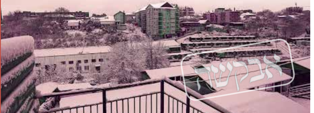
מבנה חד-קומתי אחד ישנו באומן, שם אין לאגנרל חורף' דריסת רגל. השלג בתקופת החורף באומן | תמונה: נתן צור

"מאומן חזר יואלי בן אדם אחר לגמרי. עם 'אורות גבוהים' כמו שקוראים לזה..." עכשיו תורו של שמילי לספר. "מיד אחרי שהוא נחת, הוא חייג אלי בהתרגשות ואמר שאני חייב לבוא איתו לאומן... הוא אמר לי שאין עוד מקום כזה, ואני חייב לבוא לשם לחוות את זה מקרוב. העמדת יואלי על מקומו, והבהרת לי בצורה הכי ברורה שאני האחרון שיסע עכשיו לאומן... הייתי באותה תקופה רחוק לגמרי משמירת התורה, ניהלתי בית ללא שום סממן יהודי, לא שבת, לא כשרות, כלום! אז מה ההגיון לנסות לסחוב אותי לאומן?! הסברתי את זה ליואלי, והוא, שהבין שהוא עלה על מוקש,