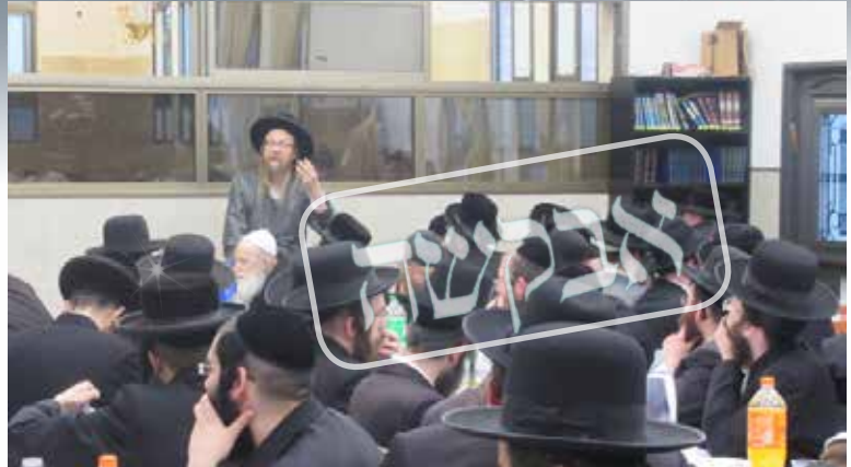
אלו שקמים בחצות יש להם הרבה יותר זמן. ר' שמעון אלי' בדרשה לחברי הכולל

אם אדם אכן מאמין בעצה של הרבי ובכל זאת הוא רואה שקימת חצות באה על חשבון סדר יומו, אז לפחות שמתי שהוא כן יכול שיקום בחצות, אבל לאמיתו של דבר הכולל שלנו זה ההוכחה שאברכים לא מבוזזים את היום ואדרבה נכנסת ברכה בזמן ומספיקים הרבה יותר במשך היום.