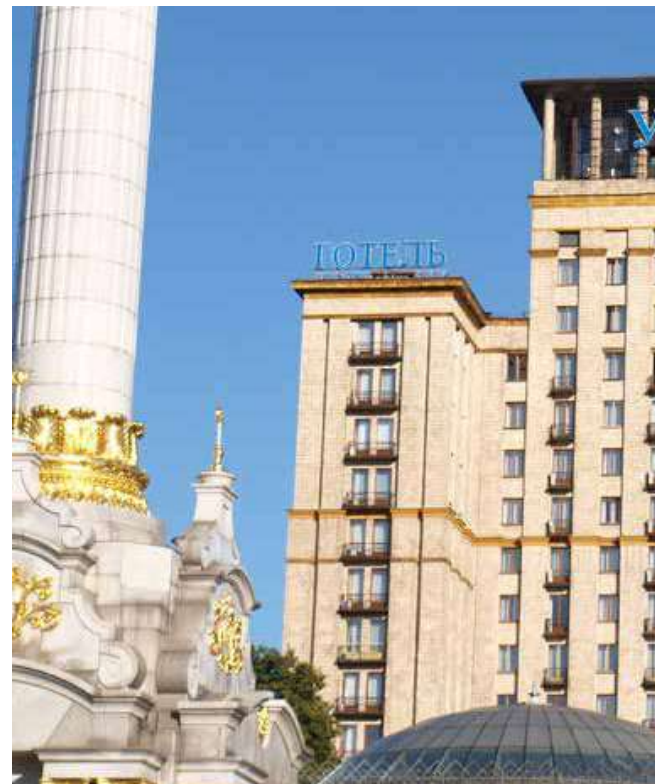
הגעתי כדי לטייל בקייב. בית מלון בעיר קייב