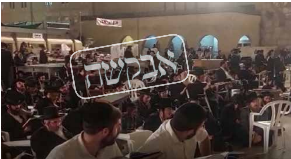
צריך רק לסדר את הזמן של השינה. אברכי אנ"ש מכלל הכוללי חצות באמירת תיקון חצות בסמיכות לשריד בית מקדשנו

מוהרנ"ת אומר על התבודדות שלעתיד זה יהיה דרך כבושה לרבים, ורואים גם בעניין הזה שלאט לאט זה נהיה נפוץ יותר ויותר. יש הרבה אנשים שרוצים לעזור לזה, והלואי שלכל אברך תהיה האפשרות ללמוד בכולל כזה