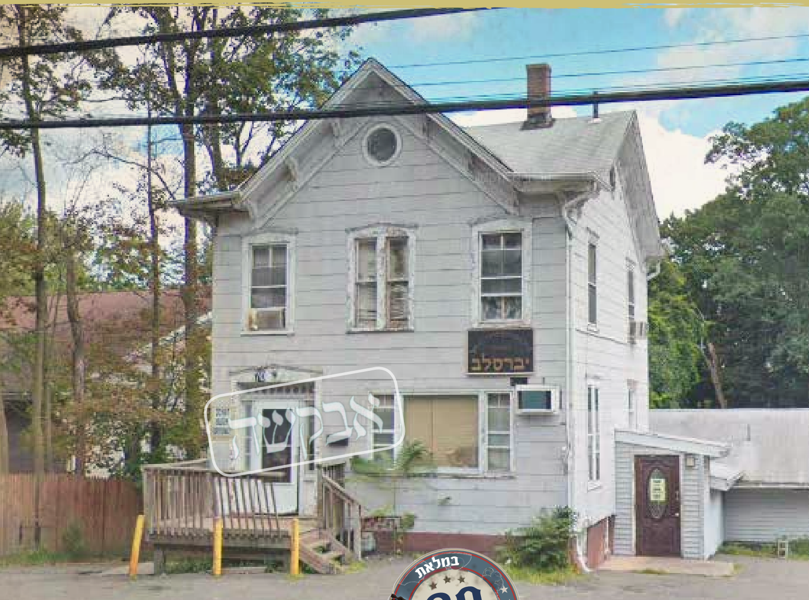
בית המדרש ברכת הנחל כיום