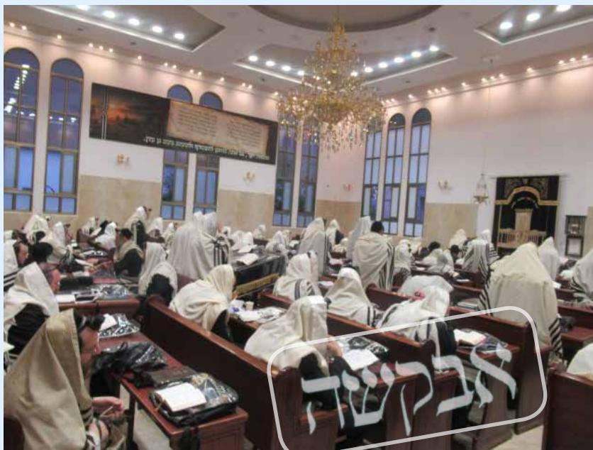
בשב"ק לא אמורים לנוח מהעבודות של יום שישי. התפילה בכוח בכולל 'חברים מקשיבים'

לכאורה מה ניתן לעשות אם הציבור אכן עייף? היכן נוכל לקבל 'כחורי פלא' כדי לסלק את העייפות?