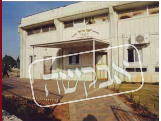
מתקיימים מניינים וסודרי לימוד. בית המדרש אור זורח בעמנואל

והתחלתי להסתובב אנה ואנה. פסעתי ברחוב פושקינא הלך וחזור ולא ידעתי מה עלי לעשות, כיצד אצליח בשעה כה מאוחרת לחזור לקייב הבירה?