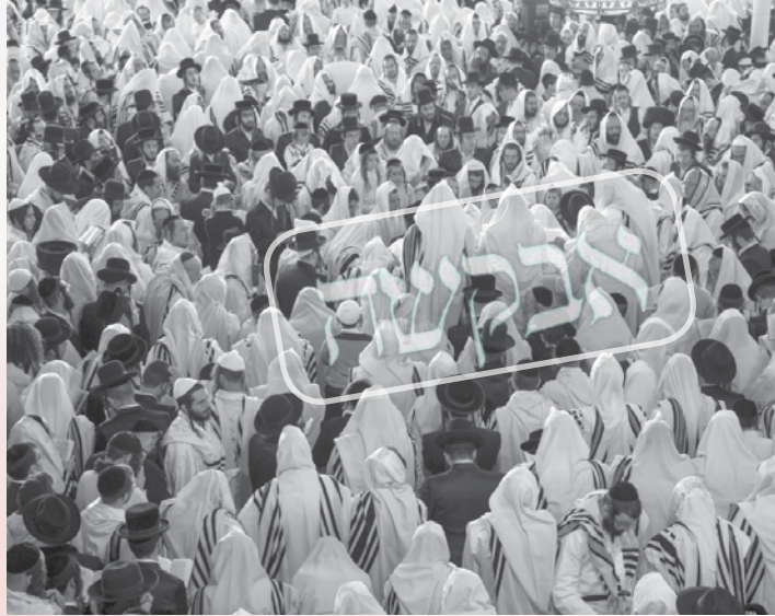
הציבור כולו מתחיל בניגון המרטיט של ראש השנה. התפילה בקלויז באומץ