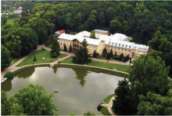
דער אפרו דארף נאלטשוב היינט-צו-טאג