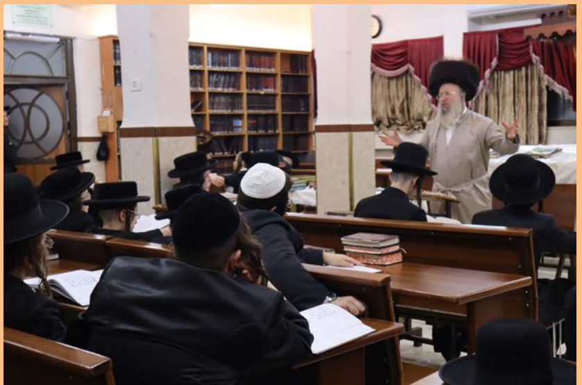
שיעור בתורה הזמנית