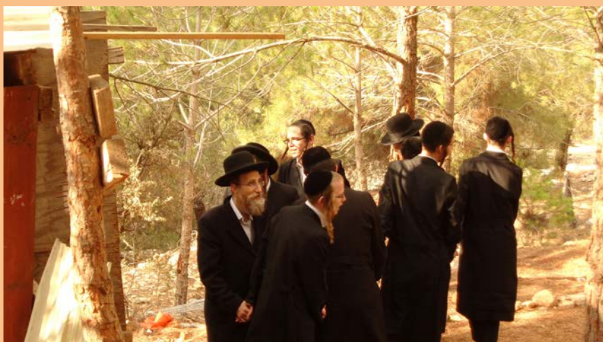
ריקוד אחר התבודדות

[ובדרך אפשר - אפשר לרמז בדברי הק' בתורה הנ"ל: לקשר את ליבו לנקודה השייך לליבו בעת הזאת" היינו בכל עת ועת לקשר - מה עכשיו רבינו הק' רוצה ממני עפ"י התורה שאני הולך עימה, מה עכשיו עלי לעשות בשביל להיכלל בצדיק ולהתקרב להשי"ת].