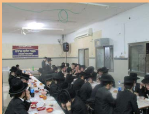
מעמד חלוקת פרסים בשיתוף ארגון תמימי דרך בי"ש לנבחני התורה הזמנית