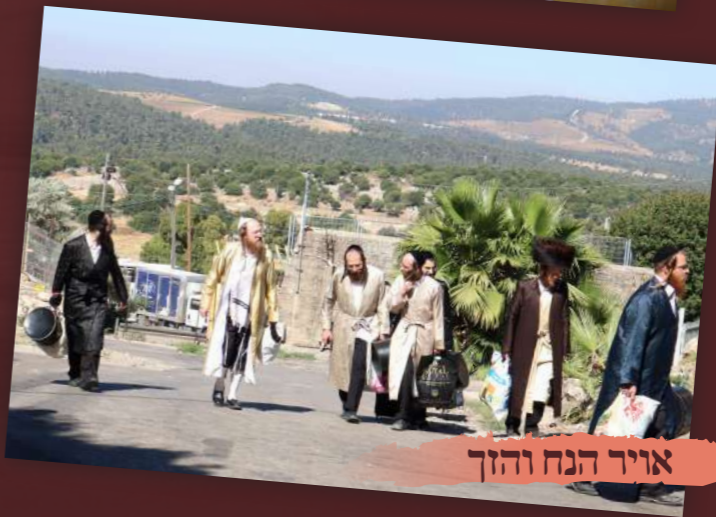
אורח הנחל והזך