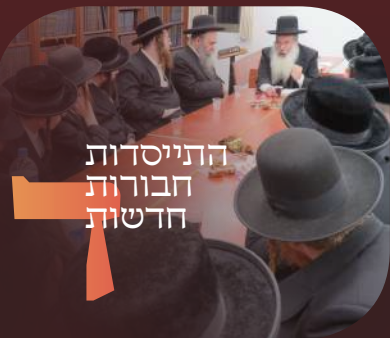
התייסדות חבורות חדשות