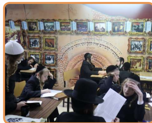
חזרה על הלימודים כהכנה להיבחון לוישיב"ק