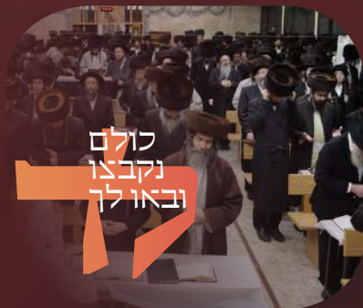
כולם נקבצו ובאו לך