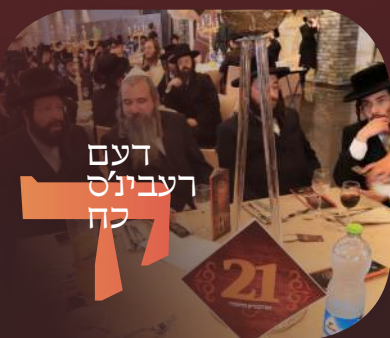
דעם רעבינס כח