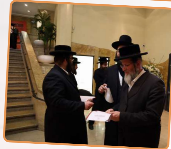
ממלאים את השאלונים לתנופת החבורות