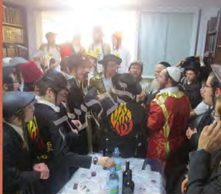
פורים בישיבת ברמלצ'ני בירק