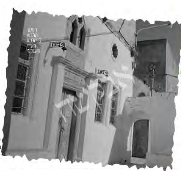
השער המבוא לבית המקדש האר"י האשכנזי