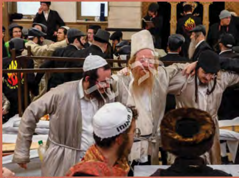
פורים תשפ"ב של ברסלב ירושלים