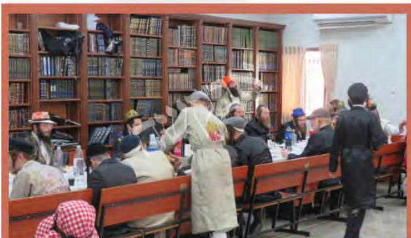
פורים תשפ"ב, תחמי דרר שכנת קנה בושם בית שמש