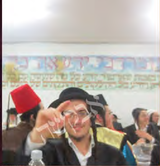
פורים בשיבת ברסלב בני ברק

מיד ידעתי ש'פורים זה החג של הברסלברס! אבל את העוצמה של ההתרגשות והכיסופים שראיתי, זו לי הפעם הראשונה בחיי, לא שיערתי אפילו לא בקצה דעתי. מאז אותו פורים זכיתי עוד ועוד להתקרב לאורו של הרבי, אבל אפשר לומר שהפורים הזה היה רגע של התקשרות, בו התחברתי בקשר כל ינותק לצדיק אמת. האור של ה'זעבשו' התחיל מאז, ומתחדש בכל פורים מחדש ממש.