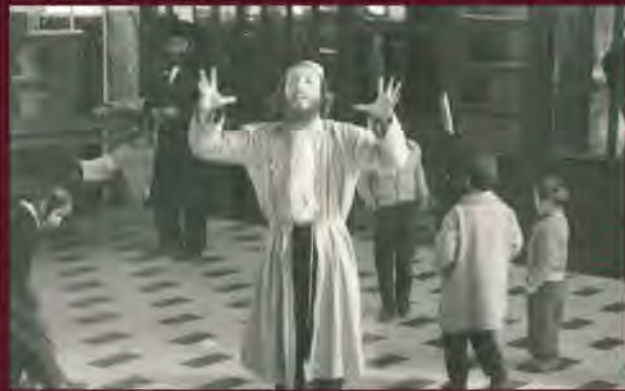
פורים תשכ"ט בשול