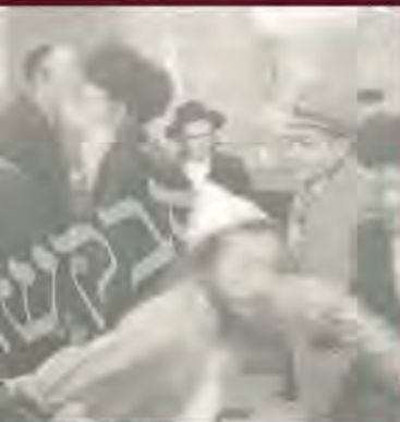
אנשי שליח ורקדים בשולחן

בשביל לקיים 'משלוח מנות', היה ר' שמואל מגביה חלה ותבשיל נוסף מהשולחן, והיה נותן אותם לי. גם אני כמוהו העברתי את המשלוח