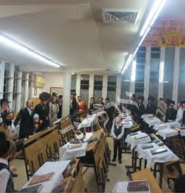
פורים בשיבת ברסלב בני ברק