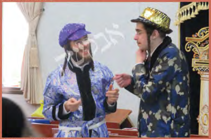
פורים תשפ"ב, תחמי דרר שכנת קנה בושם בית שמש

בעולם הזה בביזנס וכו'. אבל בפורים כל אחד מרגיש בחוש איך הרבי שם אותו במקום גבוה הרבה יותר. מן הסתם אתם מכירים את זה... שאתם נכנסים לבית המדרש בעת משתה היין, וניגש אליכם איזה אברך שלא חלמתם עליו שהוא מרגיש איזה שייכות לה', והוא מגיע אליכם עם פנים רטובות מדמעות: 'תגיד לי', הוא אומר, תוך שהוא בוכה בכי תמרורים. 'תגיד לי איך זוכים לקרבת ה'?... איך... איך???' כי בפורים כולם יכולים להתחיל מהתחלה, כולם מתחברים ומרגישים שייכים לעסק של הקדושה, ורוצים להתחיל מחדש לעבוד את ה' ולעזוב את הכל מאחור.