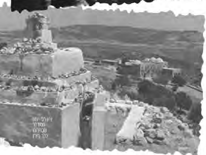
ציון רבי יוחנן הסנדלר שבתורה ספר וז"ח

לישראל, אולם אז לא ירד לעומקם של דברים, עתה שש על הגילוי כמוצא שלל רב ומדי יום היה אומרו בכוונה. הוא נעשה כבריה חדשה. בשל ההתנגדות העזה על חסידות ברסלב ששררה בצפת, נהג לומר את המזמורים באין רואים.