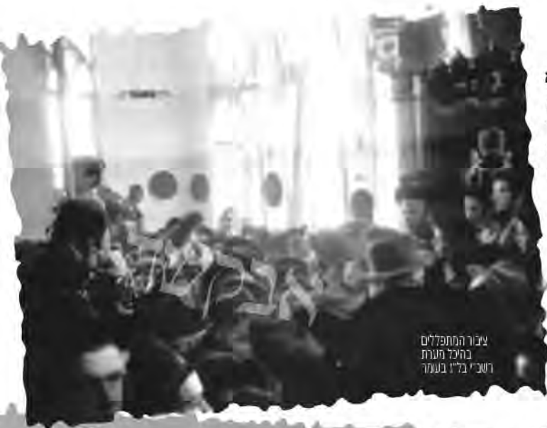
ציון המתפללים בהילולת מערת רש"י בל"ז בעמר