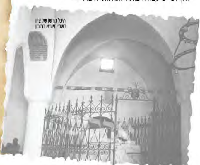
היכל קדשו של ציון רשב"י זיע"א במירון

וסיים רבי שמואל משלו: "אכן, בחסידות פלונית יכולים להעלותני עד 'אצילות', במקום אחר יבאו את 'אצילות' עד אלי, אולם מה עושים עם היצרים? 'דער אלטער מוטשעט' - הזקן וכסיל מציק ורודף, ורק לרבינו הקדוש יש עצה ורפואה לתחלואי היצר! ■