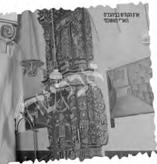
ארון הקודש בבית המקדש האר"י האשכנזי