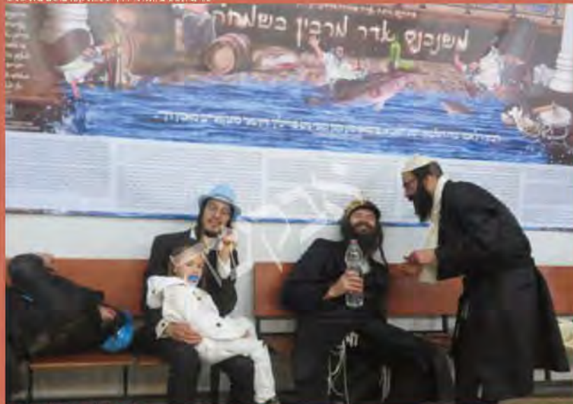
יום הפורים בבית כנסת ברסלב אור הצדיק