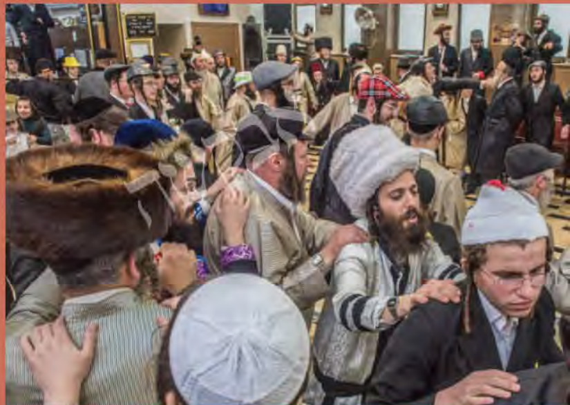
פורים תשפ"ב של ברסלב ירושלים