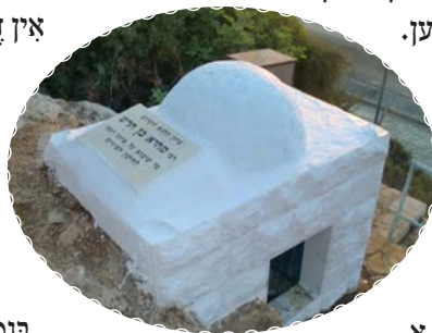
מערה העכערן קבר פון רבי מתיא בן חרש

מיר קומען אן צום אראבישן דערפל וואו דער הייליגער קבר געפונט זיך. דער וועג אַנצוקומען אהין איז גארנישט אזוי פשוט, מען דארף דורכגיין א שטיקל וועלדל. ערגעץ אינצווילשן איז דא א מערה וואו דער תנא ליגט. מען קען זען די עפענונג וואס זעט אויס ווי א לאך אין דער ערד.