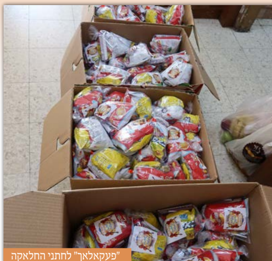
"פעקאלאך" לחתני התלאקה