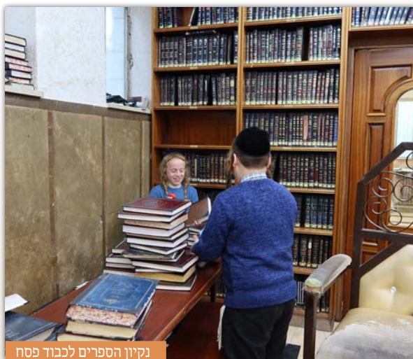
נקיון הספרים לכבוד פסח

שיעורי תורה אלו נשנו אף בימי ערב פסח בהם נשמעו עוד שיעורי הכנה לפסח מהרה"ג ר' נחמן ויינשטוק שליט"א, שרבים מאנ"ש באו לשמוע דבר ה' כנ"ל.