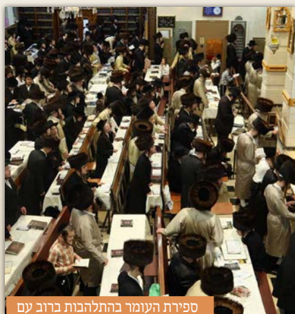
ספירת העומר בהתלהבות ברוב עם

בימי חול המועד סידרנו שיעורי תורה בבית מדרשנו בימים ג' וד' דחוו"מ, הן בהלכה שנשמעו קודם תפילה המנחה והן בחסידות ודברי התעוררות שנשמעו