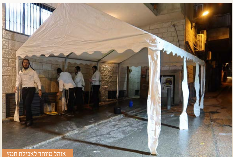
אוהל מיוחד לאכילת חמץ