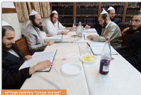
"מרבה תורה" בלילות חוה"מ