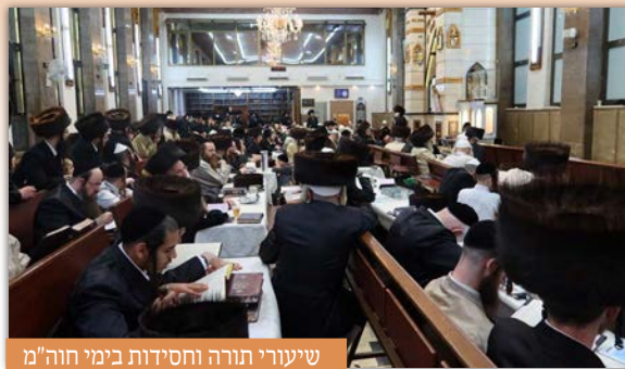
שיעורי תורה וחסידות בימי חוה"מ

לאחריו יצאו כל הציבור הק' בריקוד נלהב לכבוד המצוה ולשמחת יו"ט לכל אורך ורוחב הגג.