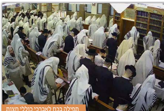
תפילה בכח לאברכי כוללי חצות