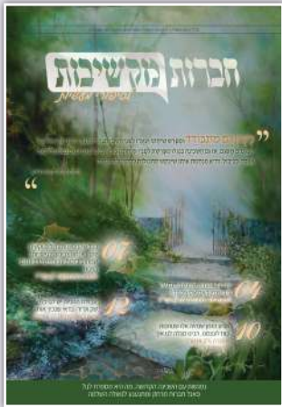
תמונת כריכה: חוה עשהאל