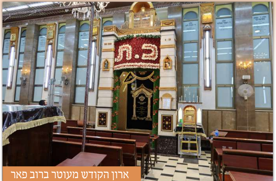
ארון הקודש מעוטר ברוב פאר

אחר התפילה זכינו גם לשמחת ברית מילה, ולאחר מכן יצאו חבורה לעלות לרגל, לעבר מקום המקדש וכותל המערבי, [שכן אלו הן השעות המסוגלות ביותר מצד שמירת העיניים], עם האמונה ששם שורה ביותר רוח הקודש של רבינו ז"ל כמובא בדברי ר' אברהם ב"ר נחמן, שם שרו ניגוני התעוררות וכיסופים להבית המקדש עם נוסחאות תפילת מוסף, השאר עלו על גג בית מדרשינו לראות את מקום המקדש.