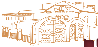
מבקשי השם שמצאו מנוח בצל רבינו הקדוש

אחרי פסח רצה אבי שאלך ללמוד בישיבה ליטאית, כדי שאשוב מרדכי ואחזור למסורה ממנה באתי, ונפשתי עם הראש ישיבה שהוא איש מורם מעם וירא שמים מרבים, לאחר שאילת שלום הוא שאל אותי האם אני בא כאן מרצוני או מרצון אבי, הודיתי על האמת שאכן באתי לחסות בצל הישיבה רק מפני רצון אבי, אבל אני מוכן לקיים מצוות כיבוד אב, הראש ישיבה שהיה איש חכם הבין את הילך הדברים ושאל אותי מינה וביה: