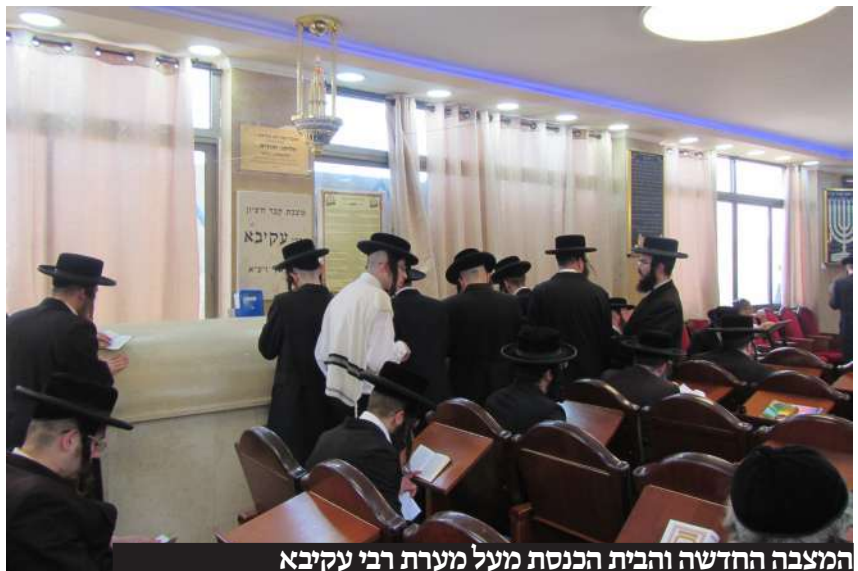
המצבה החדשה והבית הכנסת מעל מערת רבי עקיבא