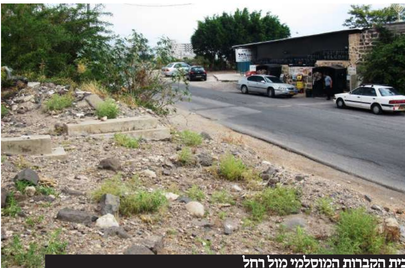
בית הקברות המוסלמי מול רחל