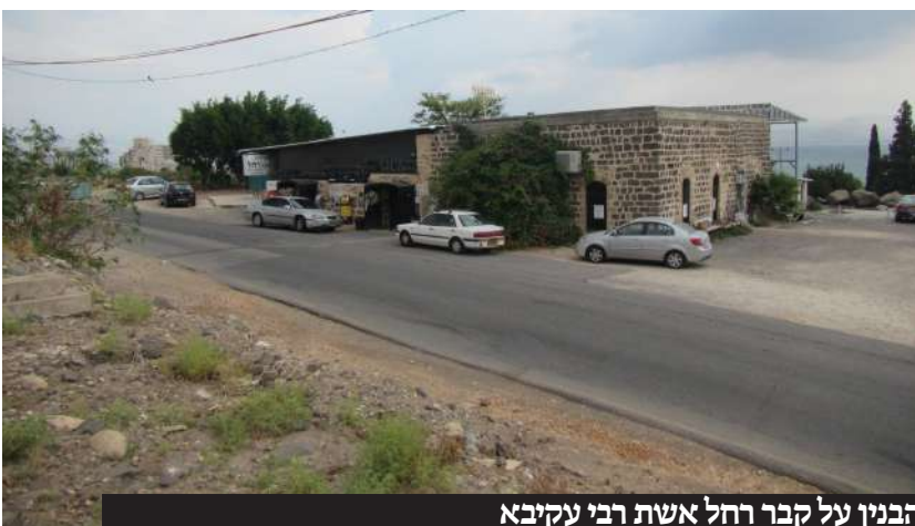
הבנין על קבר רחל אשת רבי עקיבא