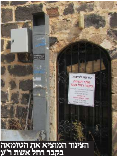
הצינור המוציא את הטומאה בקבר רחל אשת ר"ע

והשי"ת יעזרנו שבזכות רבי עקיבא ואשתו נפקד בדבר ישועה ורחמים, בביאת משיח צדקנו בקרוב בימינו אמן ואמן.