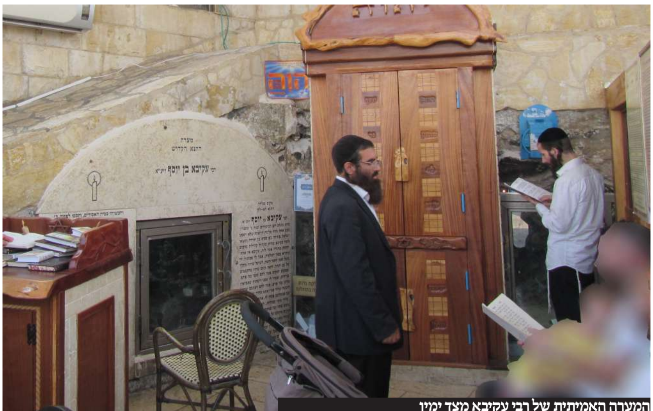
המערה האמיתית של רבי עקיבא מצד ימין

המסורות הישנות על קבר רבי עקיבא קדומות הן, אך פשוט כי המקור החשוב והנאמן ביותר, הלא הוא דברי מרנא האריז"ל כפי שמעיד בשמו מהרח"ו בשער הגלגולים וזה לשון קדשו: "תעלה משם [מר' חייא] במעלה ההר ההוא לצד מערב ונוטה מאוד לצד דרום, ושם מערת ר' עקיבא. וכבר הזכירו רז"ל כי כשנכנסו אליהו ז"ל ויהושע הגרסי נפתחה להם מערה הפנימית וקברוהו, וכשיצאו נסתמה, ולא נשארה אלא המערה החיצונה הזאת אשר כל העולם נכנסין בה. והנה המקום האמיתי המכוון כנגד קברו הוא, כי הנה פתח המערה הזו היא במזרחה,