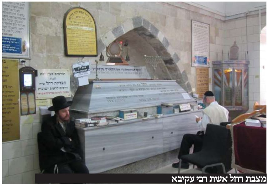
מצבת רחל אשת רבי עקיבא

אם כן נשאר לנו לדון רק לגבי המרחק של "כל אותו הלילה". והאמת שהקושיא אינה מתחילה כלל מחמת ב' סיבות: (א) מרחק ההליכה הרגלית (במהירות רגילה) בימינו מקיסריה עד לקבר רבי עקיבא בטבריה הוא כשש עשרה שעות. ואם יצאו ביום והלכו כל הלילה היו מגיעים למחרת בשעות הבוקר. (ב) והוא העיקר: כאשר נושא המיטה הקדושה הוא לא אחר מאשר אליהו הנביא, מי הוא זה ואיזה הוא אשר ינסה לעשות חשבונות על מהירות ההליכה. והדברים ברורים.