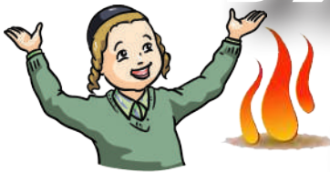
אייערע קינדער זאלט איר מודיע זיין וואס דא האט זיך גיטאן (שיהר"ן ר"ט)