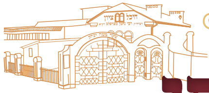
מבקשי השם שמצאו מנחה בצל רבינו הקדוש

וכאן בעצם התחיל התפנית בחיי, זה שישב ליד השולחן התפלע מאוד ממה שאמרת שהכרת פניו ואצילותו ענתה בו שהוא מאנשי הצדיק, הוא התחיל לשוחח עמי ועייץ לי להתחיל ללמוד בספרה"ק 'שיחות הר"ף' שם אוכל להבין דברי רביה"ק על בריים ולהיות את נפשי הצמאה בדברי אלקים חיים המשיבים את הנפש.