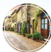
הרחוב הקרוב השקט ביותר באומן