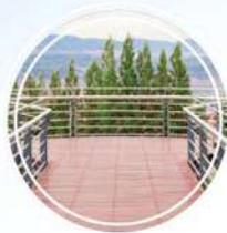
מרפסת לכל דירה