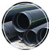
תשתיות מים פרטיות