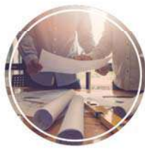
תכנון אדריכלי לניצול שטח מקסימלי