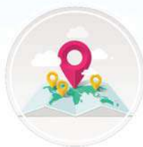
מיקום אסטרטגי בין הציון לשוק