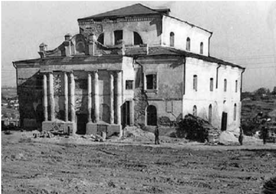
די אלטע צענטראלע שול אין אומאן