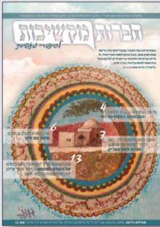
צילום: שער: אורית חיימוביץ