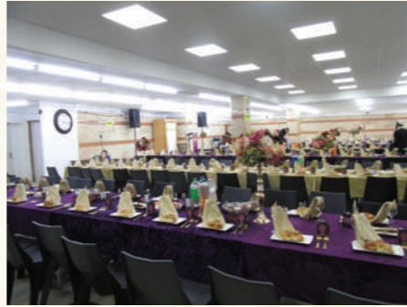
מי כאן בעל השמחה? סיום סדר מועד

לחברו כלל. כי שמחת יהדותנו, מה שזכינו להיות מזרע ישראל ולהאמין בו יתברך, הוא לכל חד כפום מה דמשער בליביה. ואי אפשר לספר לחברו כלל...] כי חפצו ורצונו היה מאד שנהיה שמחים בכל השנה כולה..."