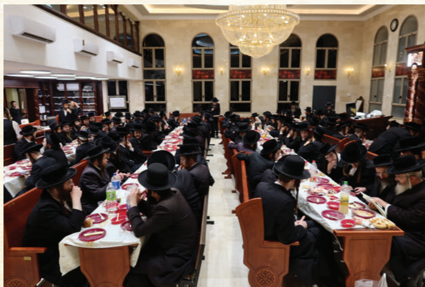
לא היה בדרך הטבע לצאת מאותו מעמד בלי קבלה חזקה, סיוס מסכת בעיה"ק צפת

נשאבים אנו במנהרת הזמן אלפיים שנים אחורה, עומדים אנו בצניעות מן הצד מביטים על אורח חייהם ותבונת שכלם של חכמי ישראל תנאים אמוראים ראשונים כמלאכים, כל דיבור שלהם, כל עובדה, כל דין, כל חידוש מרפאת את הנפש ומחיה את הנשמה. ועוד מחשבה מאוד מרגשת ומשמחת לב, היא הידיעה שבכל לימוד ומאמר הנך גורם דיבוב שפתיים וחילוץ עצמות לר' עקיבא ר' יוסי ר' טרפון, אשרינו שאנשים נמוכי קומה כמונו זוכים לדברים נוראים כאלו,