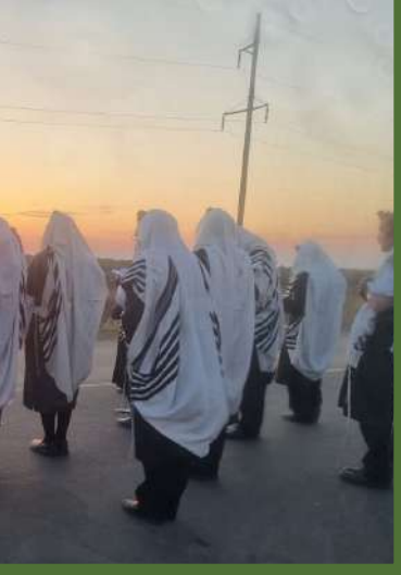
חומר ההסברה עבר יחד עם פותלות עד הגיעו ל

למודעה היתה בערך כך: 'וואו! לזה הרי חיכינו זמן רב', 'כל הכבוד!', 'איפה היינו עד היום'. הפרור ספקט נקרא בשקיקה, כשאתה רואה איך אב' רכים מהנהנים בראשם, מזדהים עם כל מילה הכתובה שם.