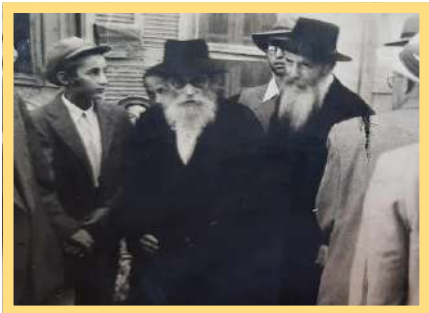
מֶרְן הַחֲזוּ"א זצ"ל