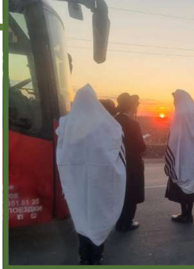
העולים את כל הדרכים המפותלות עד הגיעו לאומן

לקראת הנסיעה לקי-בוץ באומן, הודפסו מאות מודעות על ניר כרזמו משובח, ואלפי מודעות על גבי נילון לבן (באורך ק"מ) שיחזיקו מעמד במזג האוויר הסגרירי של אוקראינה, כן נרכשו אלפי חבילות טישו איכותי, עליהם הודבקו חומרי הסברה... חומר ההסברה עבר יחד עם העולים את כל הדרכים המפותלות עד הגיעו