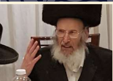
רבי ישראל הירש זצ"ל