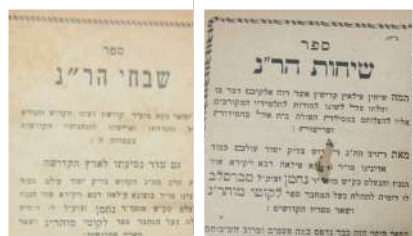
בתוך כך הבחנתי שם בקונטרס קטן האוגד בתוכו שני ספרים בשם 'שבחי הר"ן' ושיחות הר"ן.

כמובן, לא התמהמהתי מלהגיע, שם שו- חחנו בלהט על התכלית והמהות, על גבולות הגזרה שבין עצבות לשברון לב, בתוך כך הבחנתי שם בקונטרס קטן האוגד בתוכו שני ספרים בשם 'שבחי הר"ן' ושיחות הר"ן, אז לא ידעתי על איזה ר"ן הענין מדבר, אך משום מה סיקרנו אותי אותן שבחים ושיחות, ופנתי איליו בבקשה אם אוכל לשאול אותם ממנו