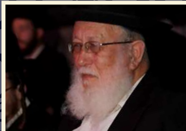
רבי יהודה קיפניס שליט"א