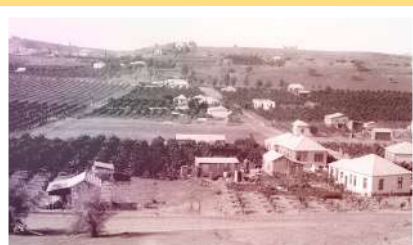
פרדסי בני ברק בהם התבודדו חברות הבחורים