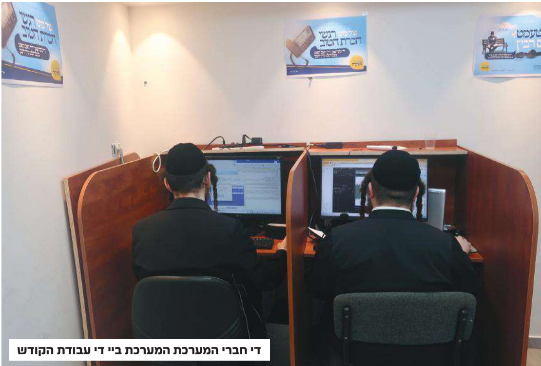
די חברי המערכת המערכת ביי די עבודת הקודש

ווען זיי האבן נאכנישט פארזוכט א טעם אין לעבן אנעם צדיק... דרוקן זיך אויס אז זיי פילן ווי זיי זענען מקורב געווארן יעצט פונדאסניי בזכות דעם ליין, זוכן דעם צדיק און זיין רוח הקודש באקומט ביי זיי א נייעם שטאנד, א דערהויבענקייט מיט התחזקות און א זעלטענע התחדשות.