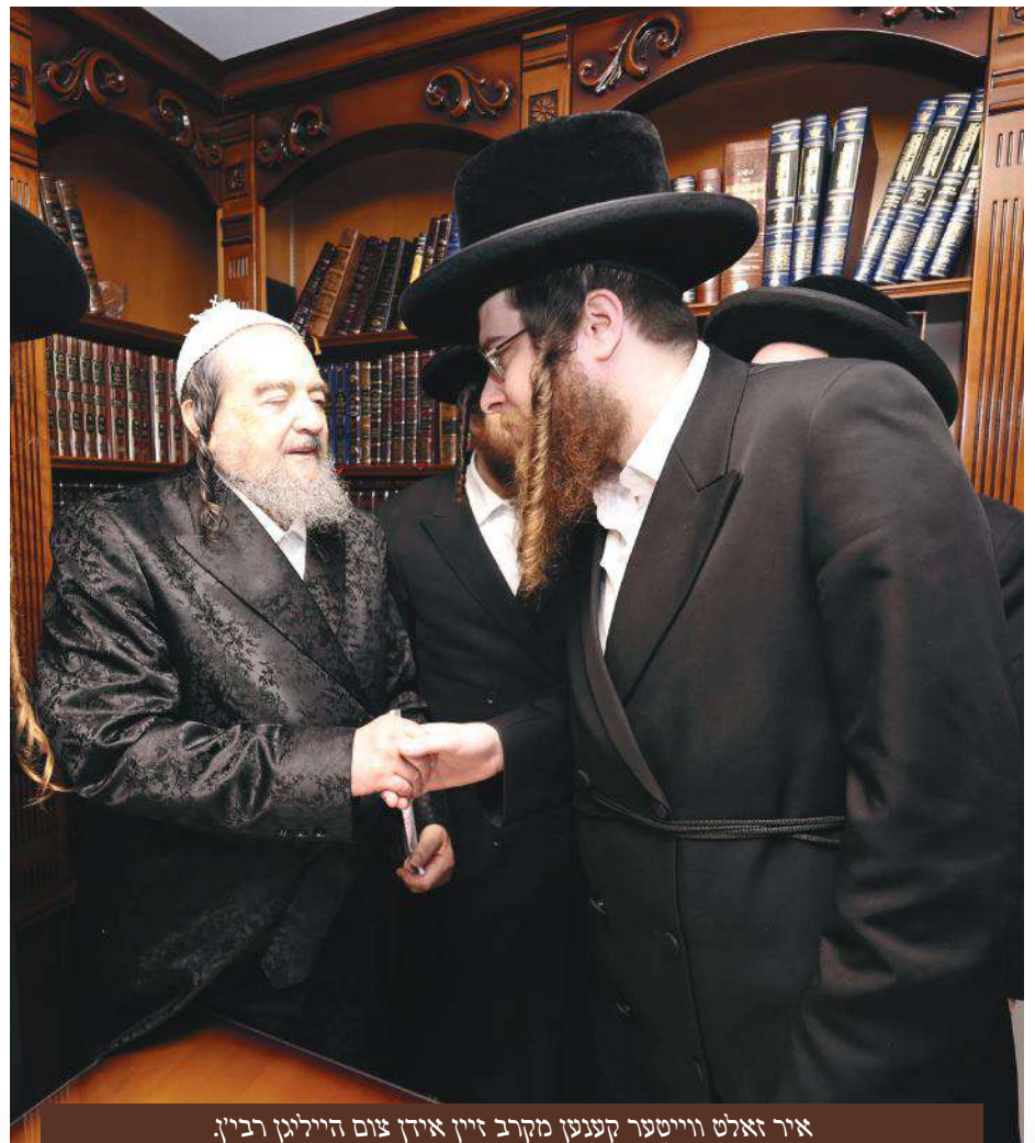
איר זאלט ווייטער קענען מקרב זיין אידן צום הייליגן רבי'ן. רי"מ שליט"א ביים אנוויינישן פאר יו"ר המערכת

דערנאך האט ער אנגעוואונטשן מעומק הלב פאר די געטרייע עוסקים במלאכת הקודש שתשרה שכינה במעשה ידיהם זיי זאלן מצליח