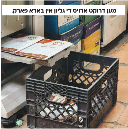
מען דרוקט ארויס די גליון אין בארא פארק.