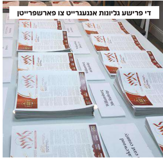
די פרישע גליונות אנגעגרייט צו פארשפרייטן

די פעולות חובקות זרועות עולם. מיט פרישע באנייטע כוחות זענען זיי ווידעראמאל אריינגעשפרינגען אין טיפע וואסערן, זיך צו פאראויסרוקן מער און מער אינעם ארבעט פון פארשפרייטן זיין הייליגן דעת אויפן וועלט, ווען עס איז זיי געקומען אויפן געדאנק ארויסצוגעבן לאור עולם א גליון מפואר מיט'ן נאמען 'האירה', א בלעטל אהערגעשטעלט בטוב טעם ודעת, וואס ברענגט דעם רבי'נס זאך אין א גאר פראכטפולן כלי, צוענדיג, אינטערעסאנט, און דראמאטיש. די גליון וואס כאפט אן אויג איבער אלע זיינע באצויברנדע אפטיילונגען, וואס ערשיינט יעדע צוויי וואכן, און ווערט געדרוקט אין די צענדליגע טויזענטער, ווערט אנגענומען אין אלע שיכטן פונעם ציבור 'כמים קרים על נפש עיפה'. אין יעדן פלאץ ווי עס ווערן אוועקגעלייגט די גליונות ווערן זיי פארקאפט ווי פרישע בייגעלעך, יעדן בית מדרש, מקוה, שטיבלאך, וואס איז זוכה צו באקומען אפאר איינצלע גליונות ווערט געזען די צמאים לדבר השם וואס ליינען מיט דארשט... אנטדעקענדיג נייע וועלטן, פארזוכן א טעם פון חיים טובים, די ריח הניחוח פונעם צדיק אמת וואס בלאזט פון צווישן אירע בלעטער, די קלאנג פונעם גאולה הכללית והפרטית וואס שרייט פון יעדן אפטיילונג און באשרייבונג פאר זיך.