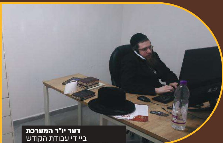
דער יו"ר המערכת בי"ד עבודת הקודש