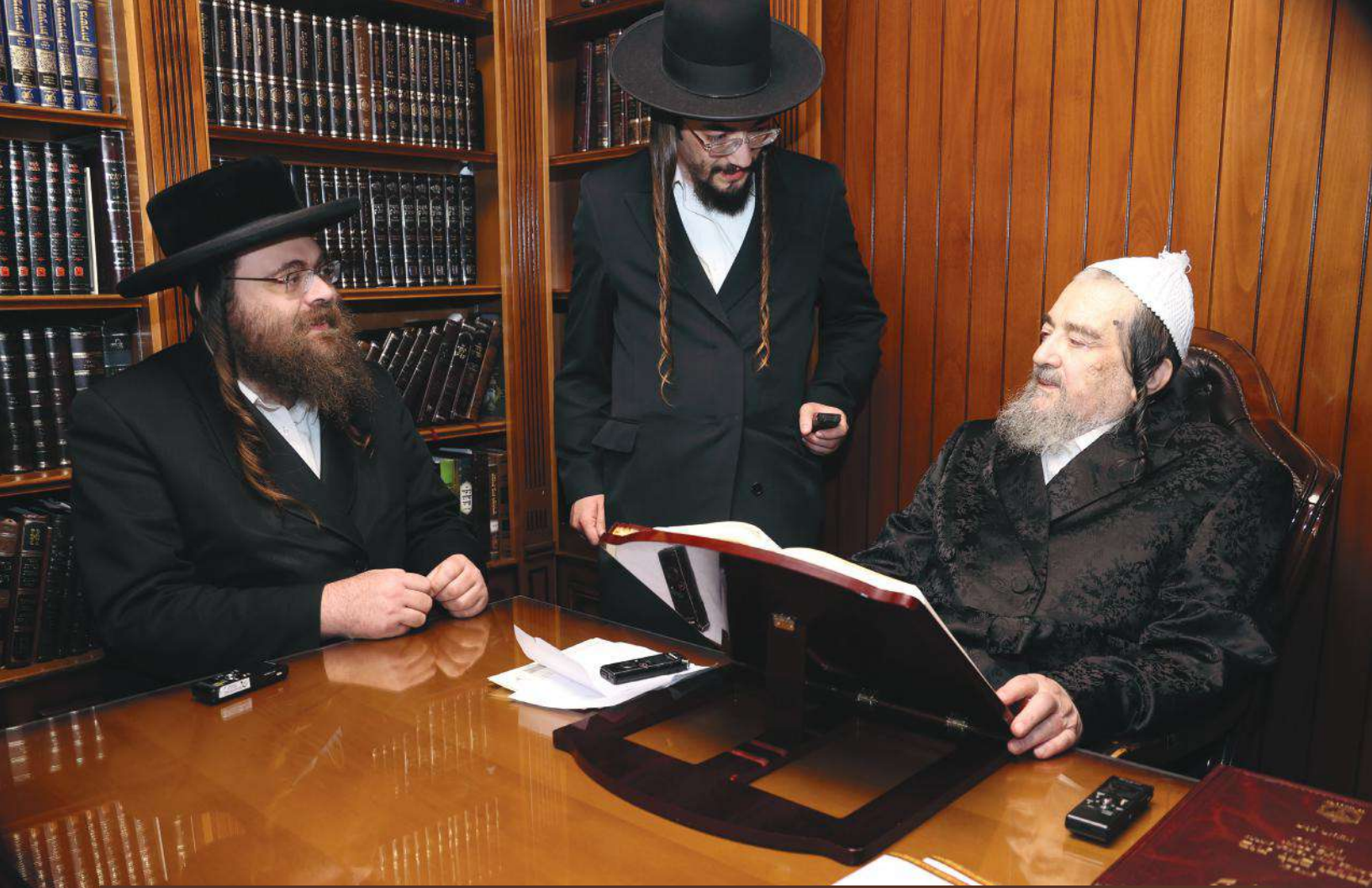
ר"מ דערמאנט זיך אין יענע יארן, ווי ער איז געשטאנען איינער אליין אנטקעגן די גאנצע וועלט, און מפיץ געווען דעם רבי'נס אור. ביים שמועס