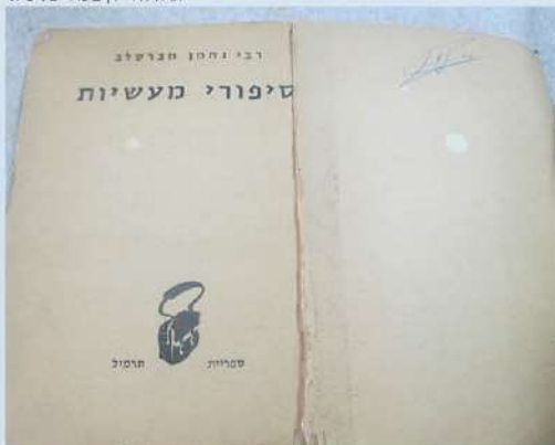
הניצוץ הראשון בהתקרבות. ספרון של הסיפורי מעשיות