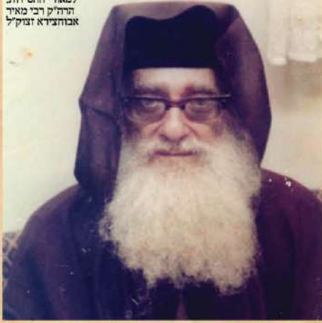
אמנו זצ"ל מרוקו קדושים יותר בשמנתו למאורי החסידות הרה"ק רבי מאיר אבוחצירא זצוק"ל

לעיין בספר הזה... אותו רב, היה אמנם יהודי משכמו ומעלה, ירא שמים גדול, אבל לדאבון לב ככה הוא שמע... שלא כדאי לעיין בליקוטי מוהר"ן. היה אז בשעתו כזאת העלמה והסתרה על העניין של הרבי.