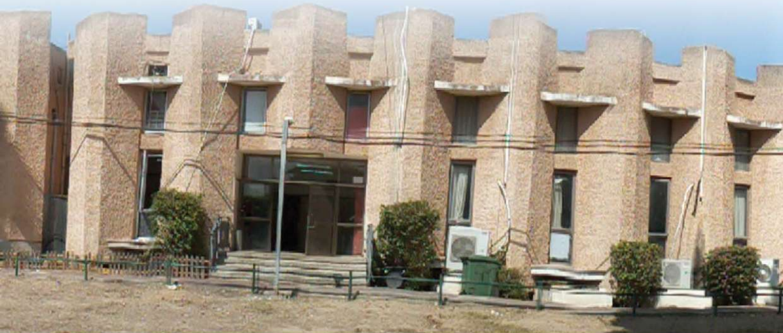
כל הישיבה סערה מוהלקרבות היה נראה שהמונים מתקיימים. ישיבת הנגב

הסיגופים והתעניות וכו', בכל זאת - הרגשתי שצוהר חדש נפתח לי בכל ה"עבודת ה'". הלב שלי ספג כזו התעוררות כך שקיבלתי לפתע השתוקקות חדשה לליקוטי מוהר"ן. ניגשתי שוב לספר אחרי פרידה קצת ארוכה וצללתי לתורה ס"ד. אהה... אני נזכר כעת כמה חיות קיבלתי מכך, לאחר מכן המשכתי לתורה ס"ה... ומאז חשתי שמקומי בברסלב.