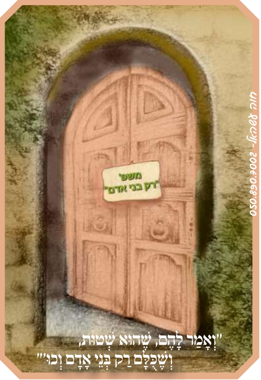
תורה אברהם - 050.890.7002

ואומר, שיש יחיד וכו' ובענין הגבור הוא אומר כנ"ל והבינו, שבנדאי הוא הבעל תפילה, כי כבר היה נתפרסם אצלם כנ"ל וצוו לחפש אחריו ולתפסו, אף על פי שהוא משנה עצמו אצלם בכל פעם כנ"ל [הינו פעם נדמה כסוחר, ופעם כעני וכו' כנ"ל]. אך הם ידעו מזה גם כן, שהבעל תפילה הנ"ל הוא משנה עצמו בכל פעם, וצוו לחקר אחריו ולתפסו. וחפשו אחריו, ותפסוהו והביאוהו אל השרים והתחילו לדבר עמו, ואמר להם גם כן כנ"ל באשר שכלם בטעות ושטות גדול,