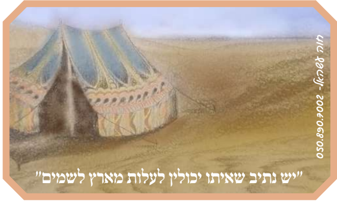
תורה אשכול - 2002, 890, 050