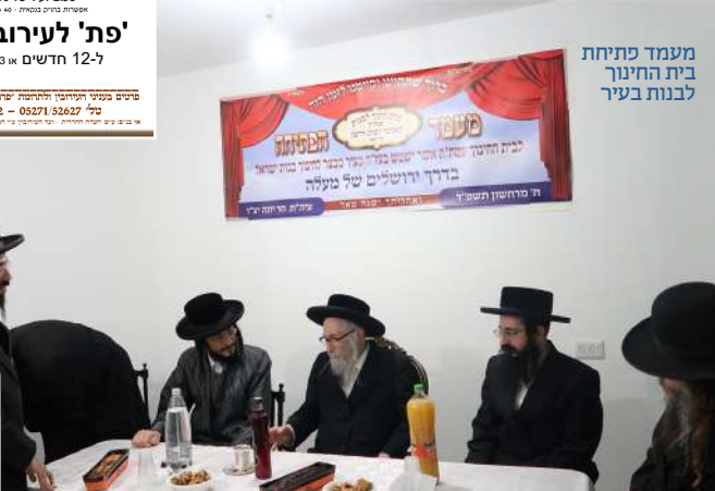
מעמד פתיחת בית החינוך לבנות בעיר