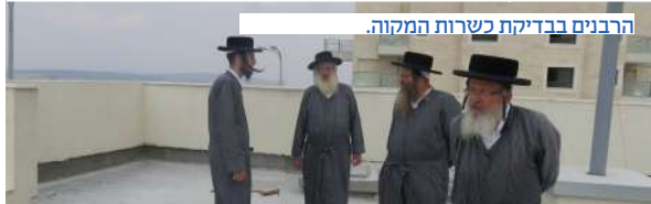
הרבנים בבדיקת כשרות המקוה.