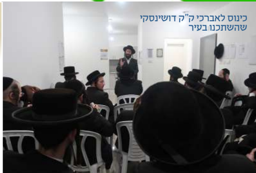
כינוס לאברכי ק"ק דושינסקי השתכנו בעיר