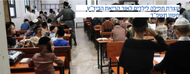
עצרת תפילה לילדים לאור הריאת הביד"ץ חשוו תשפ"ד