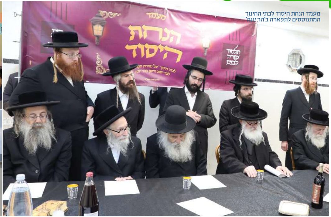
מעמד הנחת היסוד לבתי החינוך המתנססים לתפארה ב'הר צנוה'