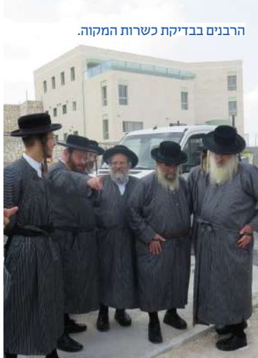
הרבנים בבדיקת כשרות המקוה.