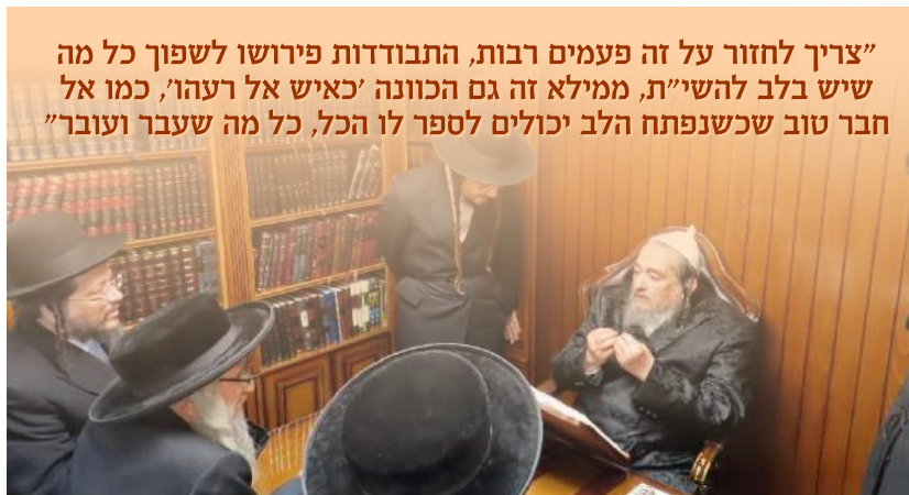
"צריך לחזור על זה פעמים רבות, התבודדות פירושו לשפוך כל מה שיש בלב להש"ת, ממילא זה גם הכוונה 'כאיש אל רעהו', כמו אל חבר טוב שכשנפתח הלב יכולים לספר לו הכל, כל מה שעבר ועובר"