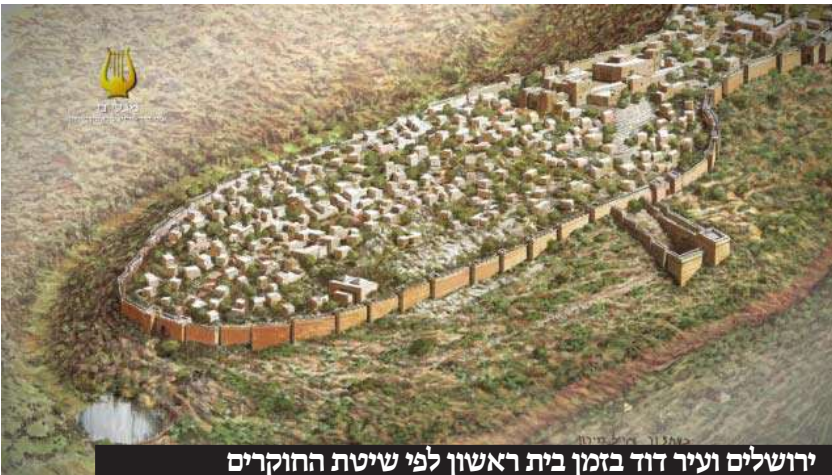
ירושלים ועיר דוד בזמן בית ראשון לפי שיטת החוקרים

וכן נקט בבירור רבינו אשתורי הפרחי בספרו כפתור ופרח (פרק מ"א), שכותב כי המקום שנקרא "היכל דוד" הוא כנגד הר המוריה לדרום, ושם היה האהל של ארון האלוקים לפני שנבנה בית המקדש. בדבריו אף מיישב את מה שמצאנו בכמה מקומות בנ"ך משמעות שעיר דוד היתה נמוכה ממקום המקדש, וזה לשונו בדבריו בהלכות מעשר שני בירושלים: "האמנם מסתברא שיש ליושבי ירושלים כפי מה שאנו רואים בזה העת, הקל מטורח הוצאת הפירות למקום רחוק, ואיך שהרי ירושלים לחוד וציון לחוד וכמו שכתוב בספר מלכים (א ה, א), אז יקהל שלמה וכו' להעלות את ארון ברית ה' מעיר דוד היא ציון. וכתוב בספר דברי הימים (א טו, א), ויעש לו בתים בעיר דוד ויכן מקום לארון האלהים ויט לו אהל, הרי שזה האהל הוא בציון. והנך רואה כי עוד היום האהל הזה עומד קיים כתחלת הייתה והוא בכיפה וכנגד