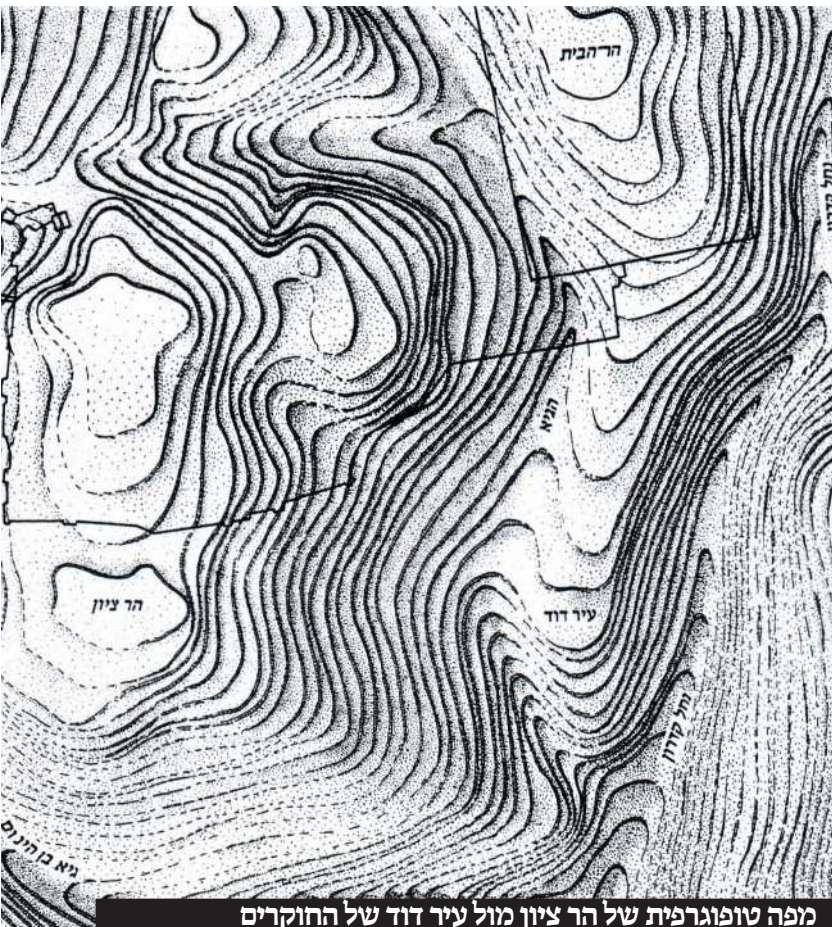
מפה טופוגרפית של הר ציון מול עיר דוד של החוקרים

היה הר הבית גבוה מירושלים". (יצויין כי בפרק ו' כשהוא דן על הר ציון וכסא מלכות דוד הוא מצייין לדבריו אלה בפרק מ"א עיי"ש).