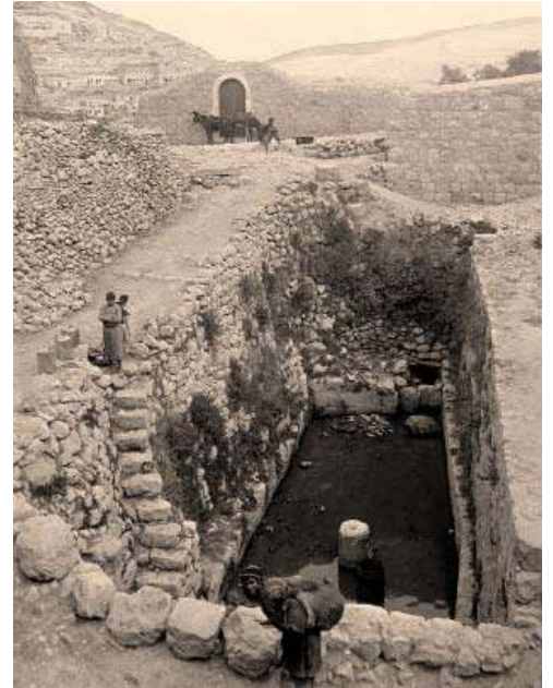
בריכת השילוח לפני למעלה ממאה שנה

'מערבה לעיר דוד' למדתי מפי רבותי נ"ע דאין הכוונה שהמים הם למערבה של עיר דוד, כי אדרבה הם עומדים היום במזרחה של עיר דוד, אלא הכוונה הוא דהנהיג המים לצד מערב כלפי עיר דוד שהוא במערבית דרומית של ירושלים, נמצא שמים אלו הם היום במזרחה של עיר דוד היא ציון אשר שם קברות מלכי בית דוד".