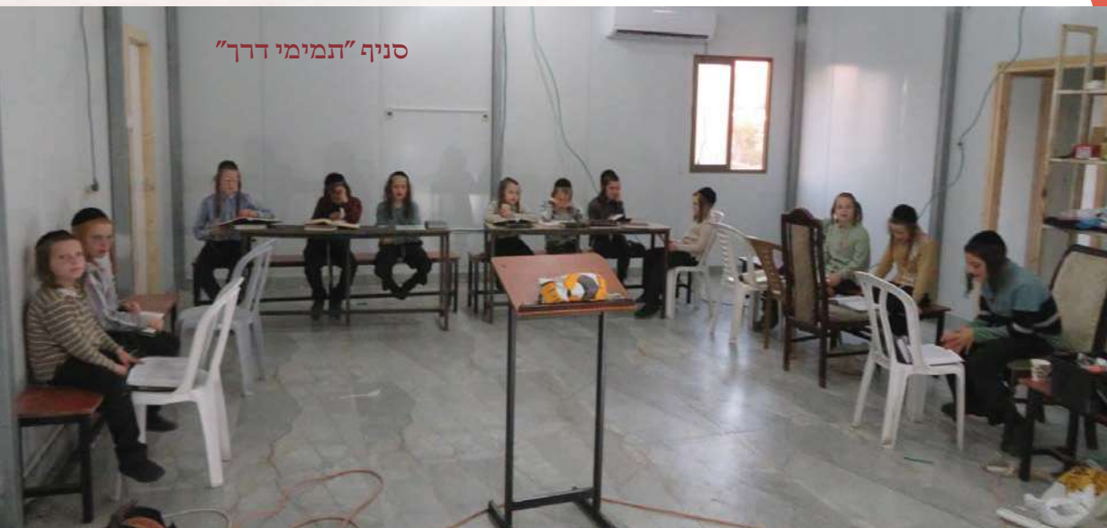
סניף "תמימי דרך"