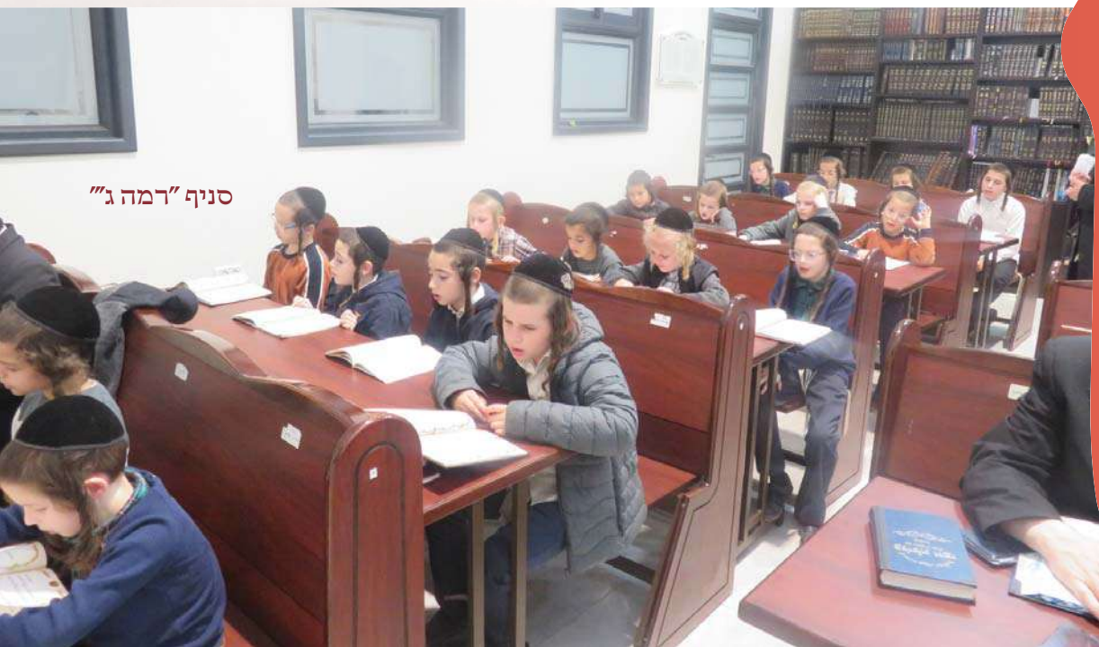
סניף "רמה ג"