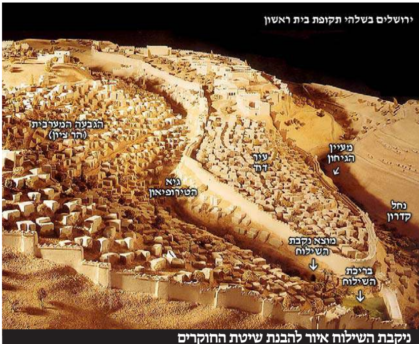
ניקבת השילוח איור להבנת שיטת החוקרים

והתקבל באהבה וחיבה בעם ישראל על כל גווניו ושבטיו.