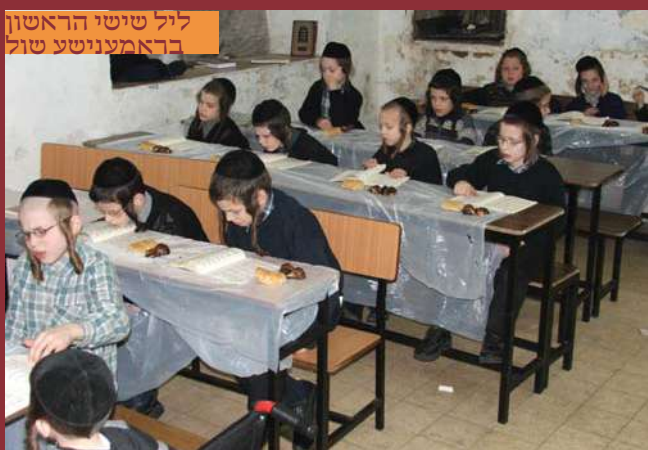
ליל שישי הראשון בראמענישע שול