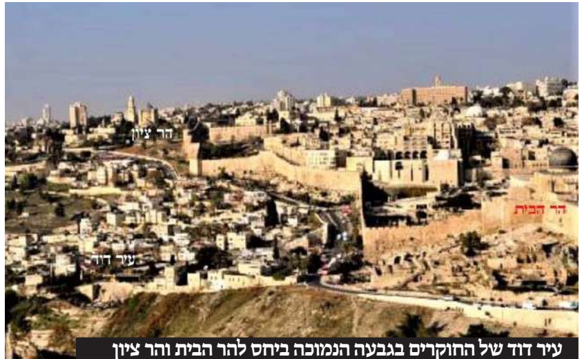
עיר דוד של החוקרים בגבעה הנמוכה ביחס להר הבית והר ציון

היכן הם כל המקומות הללו איננו יכולים כיום לדעת בבירור, וכבר כתב רש"י על פסוק זה לגבי המעלות היורדות מעיר דוד "הם היו מכירים מקומות הללו", כלומר אנו בימינו איננו מכירים אותם. ואחריו כמעט כל מפרשי הנ"ך לא ניסו לפרש היכן הם המקומות הללו, חוץ ממפרש אחד ויחיד שנכנס לעובי הקורה והוא כן מפרש בפרוטרוט את כל הפסוקים האלו, הלא הוא רבינו המלבי"ם, שפירושו על הנ"ך התקדש