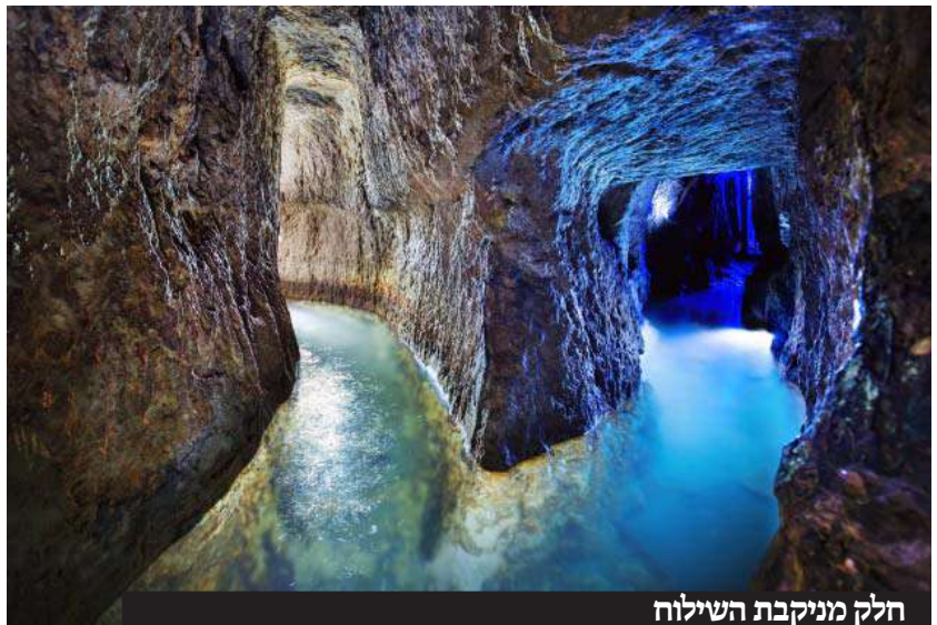
חלק מניקבת השילוח

אומר ועלה כי ירושלם גבוה מכל הארצות". כלומר, שכאשר הפסוק מציין דרך להר המוריה ומקום המקדש, הוא משתמש בלשון עליה גם אם מדובר בירידה.