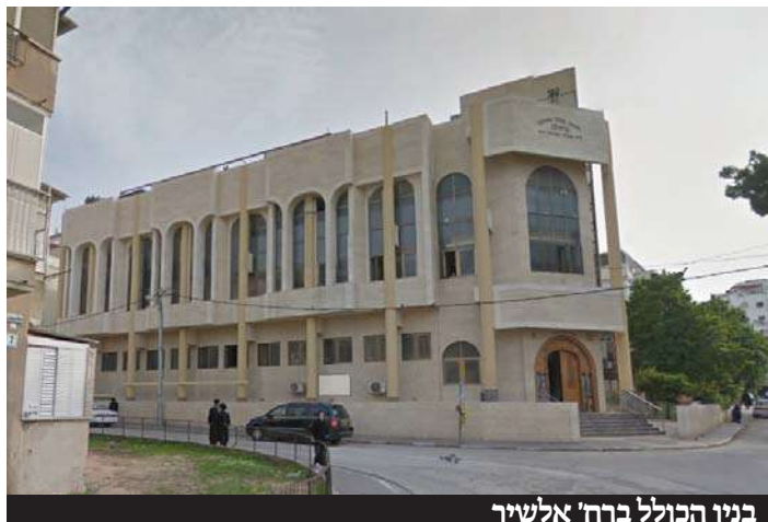
בניין הכולל ברח' אלשיך