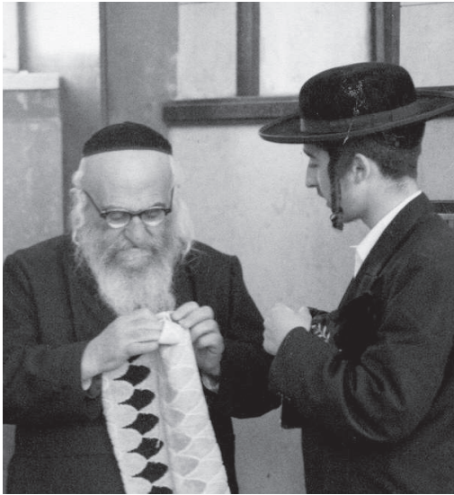
לכל נכד היה שמור מקום בליבו. ר' לוי יצחק בשול במאה שערים

את השאלה וקיבלתי עליה תשובה. המשכתי ללוותו עד הבית, בעודי חושבת בליבי 'עכשיו אעלה הביתה, אשב איתו כחצי שעה, אתענג ואתעדן במחיצתו...' הגענו לכניסה לבית, היו שם שלוש מדרגות לפני הכניסה. לפתע הסתובב הזיידע ואמר לי בנעימות: 'א גוטע נאכט!' - 'לילה טוב'. מיד ידעתי שאין לי יותר מה לעלות. תוך ארבע דקות הוא יגמור את הארוחה וילך לישון לקראת חצות. הבנתי שאני צריכה לעשות אחורה פנה... זהו, הסתיים הזמן במחיצתו. אבל אני הייתי מאוכזבת אחרי כל הנסיעה הזו. אך הפנמתי - הזמן שלו יקר! ה'עבודת ה' שלו חשובה. הרי באתי למטרה מסוימת, והיא הושגה, אז מה לי להלין? הסתובבתי חזרה, ונסעתי הביתה.