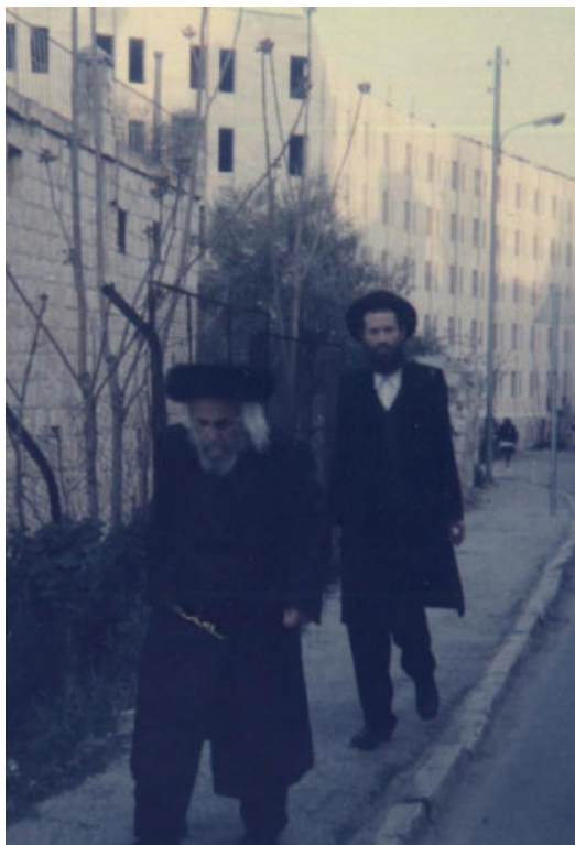
זמנו היה שקול ומדוד. ר' לוי יצחק בדרכו ל'שול'

מרום עבודה שהיתה עליה. היא שלחה אותי לשאול את הסבא, והסבא דפק ואמר - קודם כל חסה! בלי חסה אי אפשר ליל הסדר. הוא יצא איתי למרפסת, כיסה שולחן במגבות נקיות, והראה לי איך בודקים. הרים עלה לשמש, הסתכל, הפך, ושם את העלה על המגבת הנקייה.