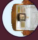
70 מטר מהציון

לובי מפואר • גישה לרכב גם בראש השנה • שמירה 24/7 • ללא חשש קברים • מאוכלס כל השנה