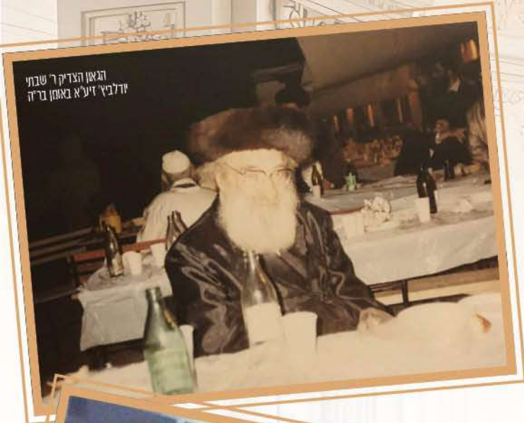
הגאון הצדיק ר' שבתי זילביץ זיע"א באומו בריה