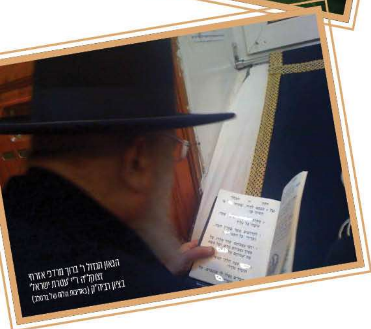
הגאון הגדול ר' ברוך מרדכי אהרן זצוק"ה ר"י עטרת ישראל בציון רביה"ק (מדינת יהודה של בית) ב