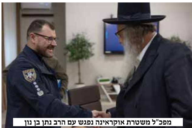
מפכ"ל משטרת אוקראינה נפגש עם הרב נתן בן נון

לגבי התפילות: גם כאן, כפי שהיה בשנתיים האחרונות: כל התפילות לא יתחילו לפני סיום העוצר, כולל סליחות "זכור ברית" לאשכנזים, שיחלו לאחר סיום העוצר ולדבריהם, לא יהיו אישורים חריגים.