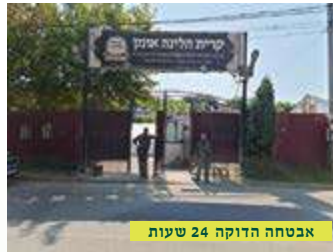
אבטחה הדוקה 24 שעות