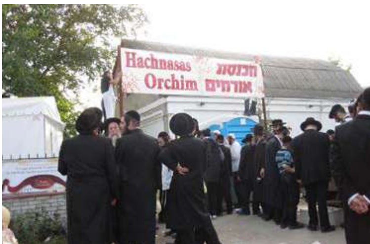
שלט הכנסת אורחים. תש"ע. כניסה לפושקינה 20