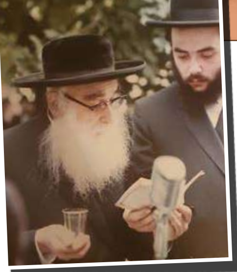
הגאון רבי שמעון ישראל פאזען אב"ד שאפראן

ספרי רבינו הקדוש שגורים היו על לשונו תמיד. תדיר נשא עמו את הספר הקדוש 'ליקוטי מוהר"ן'. בשנותיו האחרונות, בספר מכתביו של הגאון