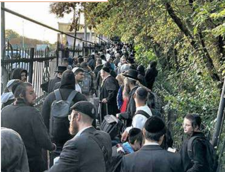
מאות חסידים מעוכבים בגבול מוגילוב פודולסקי החוצה למולדובה

גם מבחינה כלכלית, הם רושמים בכל יום הפסדים במיליארדי דולרים - ומזווית הראיה שלהם, חסידי ברסלב לא הם אלה שיושקמו את כלכלתם המרוסקת.