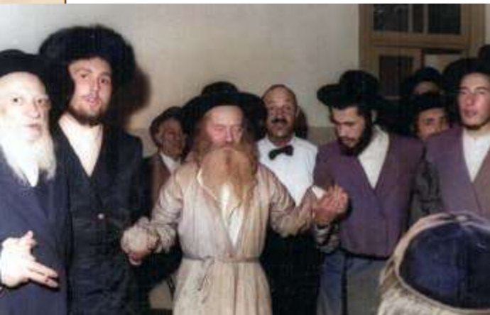
קשר נעלם לחסידי ברסלב. האדמו"ר ר' משה מרדכי מלעלוב זי"ע

כמוכן שאין אתנו יודע עד מה לשער ולכוון דעת גדולי עולם, אך כאשר נשאל פעם ע"י אחד ממקורביו על מנהג זה, השיב לשואלו הרה"ק רבי נחמן מברסלב זי"ע היה מהצדיקים היחידים שעסקו בקירוב הגאולה וביאת משיח צדקנו ע"י ארץ ישראל.