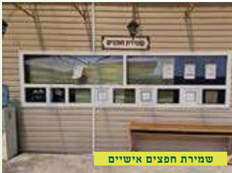
שמירת חפצים אישיים

סטתי למדינתו של אותו אדם, הגעתי לביתו, הוא קיבלני ברחובה של עיר, אפילו לא הכנסני אל ביתו, מוסר בידי מעטפה חתומה ומפטיר, 'לפעמים מה שלא יתכן גם יתכן', ונכנס לביתו, אני צועד מספר צעדים פותח בהססנות את המעטפה ומגלה שם המחאה על סך $180,000 מזומן. הרגשתי אז שהקב"ה מחייך אלי ואומר לי אני איתך עמך ואצלך. אל תדאג. חזרתי ארצה מאותה מדינה. ומשם שוב לאומן כשהר"ה עבר בשובה ונחת. ברוך הוא וברוך שמו. והלימוד המלא מוסר השכל, אתם חשבתם את השוד לרעה והקב"ה גלגל לכם בכפליים הרחבה וישועה מעל לדרך הטבע.