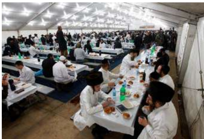
תשע"א - צולם ע"י גוי. ניתן לראות שיש הרבה מקומות ריקים כשהמקומות לא נמכרו

"לְכוּ אֲכֹלוּ מִשְׁמַנִּים וּשְׂתוּ מִמַּתְקִים וְשַׁלְחוּ מְנוֹת לְאִין נֶכֶן לוֹ, כִּי קָדוֹשׁ הַיּוֹם לְאֲדֹנָינוּ, וְאֵל תַּעֲצֵבוּ כִּי חֲדָת ה' הִיא מְעֻזָּכֶם... וְיִלְכוּ כָּל הָעָם לֶאֱכֹל וּלְשַׂתּוֹת וּלְשַׁלַּח מְנוֹת וּלְעֲשׂוֹת שְׂמֵחָה גְדוֹלָה כִּי הִבִּינוּ בְּדַבְרֵים אֲשֶׁר הוֹדִיעוּ לָהֶם."