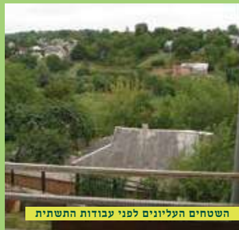
השטחים העליונים לפני עבודות התשתית