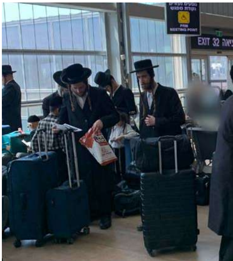
חסידי בדרך לרבי

מסעינו ממשך לעבר התחנה המעניינת, המסקרנת, וכנראה הכי