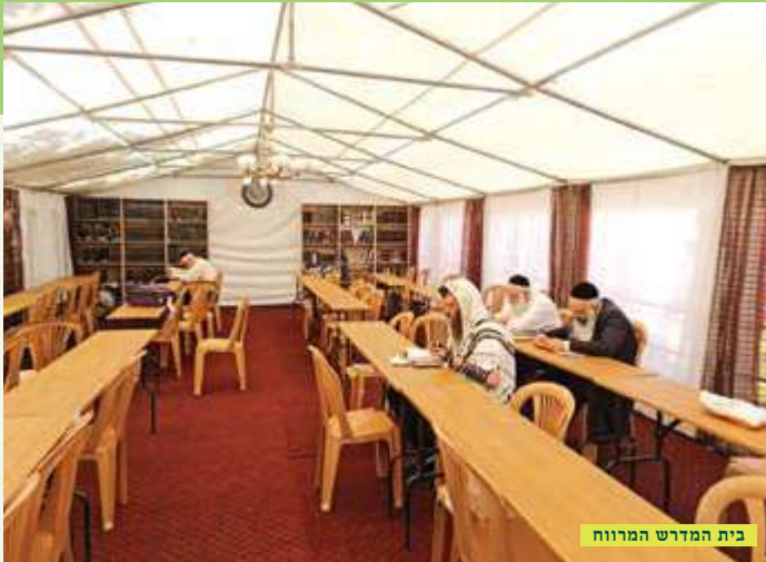
בית המדרש המרווח