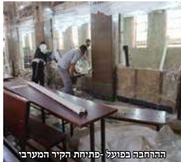
תהלתתפה בפועל - פתחתת הקידר המערב