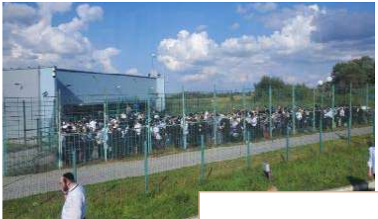
חסידים בגבול עם מדינת פולין

מלבד זאת, ישנם כללים רבים בתעופה שלא ידועים לנוסע הרגיל, אך מטרידים מאד את סוכני הנסיעות. למשל, כאשר מטוס מתעכב מעבר לשעה מסוימת, הצוות שלו 'נשרף' בשפת התעופה. משמעות הדבר שהמטוס הזה לא ימריא עד שימצא לו צוות חדש (או עד שיעבור זמן המנוחה של הצוות הזה, ויאפשר לו לשרת שוב את הטיסה). מה שידרוש מהסוכן לסדר לנוסעים סידור חילופי שלא תמיד מעשי.