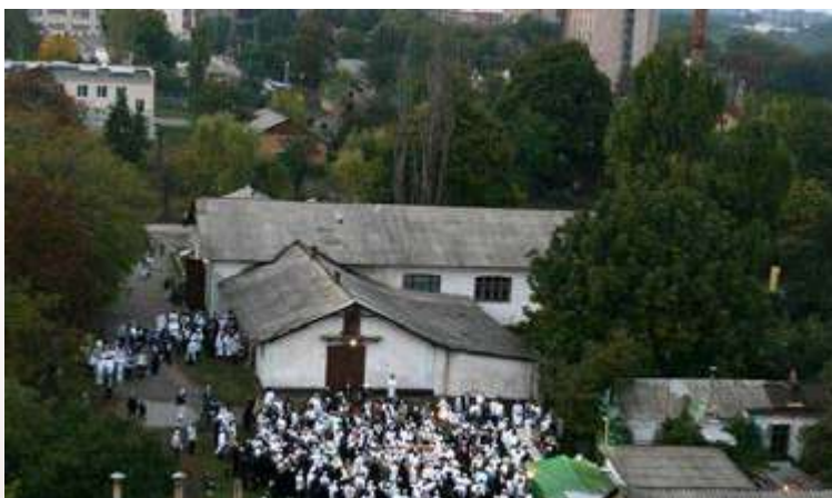
תשס"ט. השטח הויטרני לפני הכנסת אורחים