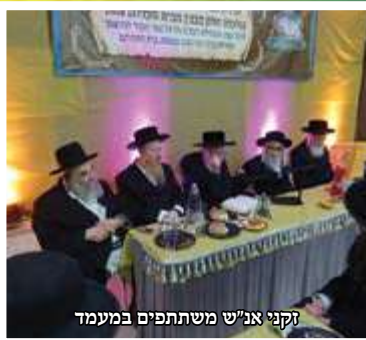
זקני אנ"ש משתתפים במעמד