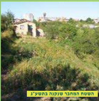
השטח המחבר שנקנה בתשע"ג

קרית הלינה אומן מקום לינה וטיפול לאלפי עליי ציון רביה'ק זע"א