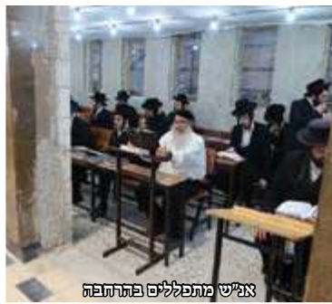
אנ"ש מתפללים בפתרתתפה

האוהל והיה אחד' (שמות כ"ו). כן הזכיר את המעשה הידוע ממוהרנ"ת שנסע לחתונת בתו והמתנגדים סקלו את עגלתו באבנים וברח אל היער בחלישות הדעת עצומה, ור' נחמן מטולטשין שמע כיצד הוא מדבר שם להשי"ת ואומר על עצמו, "הרי אפילו כאשר השואב מים מחתן את בתו אין הוא מקבל אבנים, אלא כל "חטאו" שהוא מדבר מרבינו, והתחיל לשורר בניגון של 'אשת חיל' "אונזער גרויסקייט און אונזער שיינקייט וועט מען זעהן ווען משיח וועט קומען"... ואפשר להמליץ על השלמת ההרחבה, כי הן אמת שבוודאי יתקיים הדבר בשלימות לעתיד לבוא, אך כבר כעת רואים איזה התנוצצות ומשל לקיום הייעוד, כשזוכים לראות הן 'גרויסקייט' כאשר ביהמ"ד הגדול הורחב והתפשט עוד! ובד בבד רואים גם 'שיינקייט' שביהמ"ד הורחב לשם ולתפארת ביופי וכן שאין כדוגמתו.