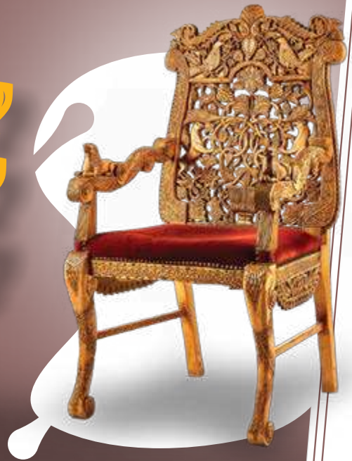
חזיר הנח וחדן | קיבוץ ר"ה תשפ"ה | #02