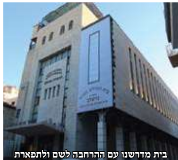
בית מדרשנו עם ההרחבה לשם ולתפארת