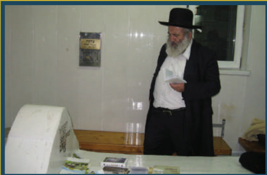
אצל התלמיד הגדול. הרב ע"ה בצינו של רבי נתן מברסלב בעיירה ברסלב, אוקראינה