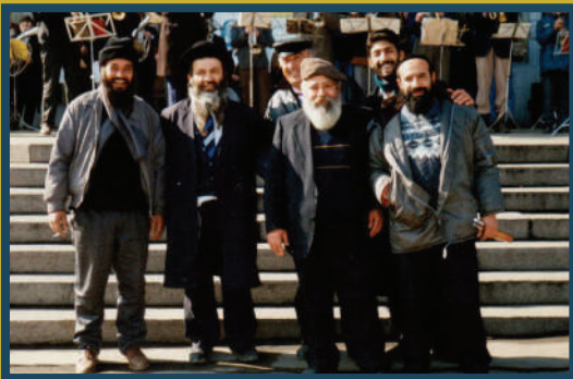
יחד עם תלמידיו בסמיכות לציון של מוהר"ן

הרב הסתפק מאוד, עד שלבסוף נעתר לבקשתם. נסעה הקבוצה יחד עם אבי, השתטחו בכמה מקברי הצדיקים עד שלבסוף הגיעו לאומן. כמובן שבאותה תקופה, לא היה את המבנה שאנו מכירים וגם לא את המצבה המוכרת לכולם.