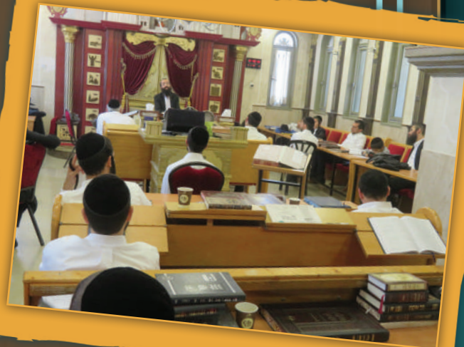
ישיבת בין הזמנים, ביתר עילית

סגנון הישיבות הספרדיות, שמכיר היטב את המנטליות של הצוות ורבני הישיבה. אחרי שהבחור יקבל אמון, ניתן יהיה לכוון אותו לזרם הנכון והמיושב בתוך ברסלב, כפי המסורת המדויקת והראויה, מבלי שהבחור יצטרך לעבור סבב חיפוש ארוך ומורכב.