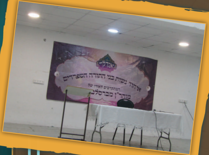
כנס הכנה לראש השנה לנשות האברכים בעיר צפת

ולכן כאשר נצליח בס"ד לגבש את המשפחות של אותם אברכים מקורבים, לערוך להם כנסים פנימיים מפעם לפעם, עם תוכן מיוחד ומתאים, זה ייתן לאשה המון כח. היא תבין ותרגיש שבעלה משויך לזרם מסוים ומאורגן בתוך ברסלב. היא תרגיש שבעלה לא הפך למשונה אלא כמוהו יש מאות רבים. ב"ה במהלך חודש אלול, זכינו לערוך כנס ראשון מסוג זה בעיר צפת. המשתתפות התבקשו להירשם מראש מאחר ולא ידענו מה תהא ההיענות. המארגנות אמרו לעצמן: אם תבואנה שלוש נשים לכנס, נקרא לזה הצלחה גדולה. למעשה, השמועה עברה מפה לאוזן ובסיום הכנס התברר ששמונים וחמש נשים (!) השתתפו בכנס המיוחד. אלו הן נשים ספרדיות מבתים תורניים שלראשונה נחשפו מקרוב לענייניו של רבי נחמן מברסלב. פתאום הן התחילו להבין בעצם מה מרגש כל כך חזק את הבעלים שלהם. ההרצאות, מנחת הערב והרבניות, כולן בעצמן נשים שבעליהם התקרבו לברסלב וזה נתן למשתתפות תחושה חזקה של הזדהות והרגשת שיוך מיוחדת. אין ספק שהכנס הזה נתן להנהלת