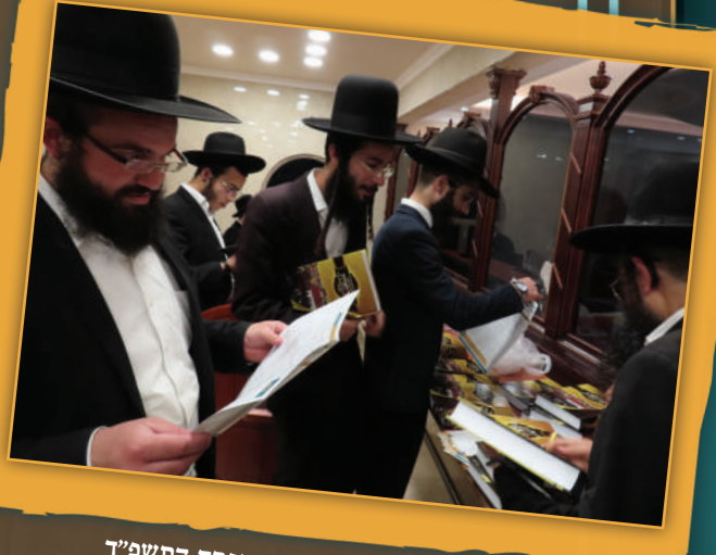
צפת. בקבלת שיי לכבוד חג הפסח התשפ"ד

הארגון את ההבנה עד כמה היוזמה הזו מבורכת ונצרכת בערים נוספות בארץ.