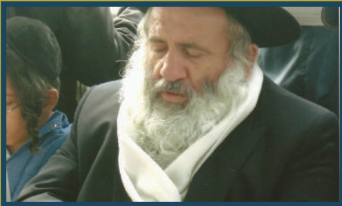
את שאהבה נפשי. בציון רבינו הקדוש באומן

בכלל, נרקם קשר מיוחד ומעניין בין סבא לר' בנימין זאב חשין. אבי ש י ח י מ ס פ ר ש ה ו א ו א ח י ו ה י ו מ מ ש מ ב א י ב י ת מ ש פ ח ת ח ש י נ ו א פ מ ש פ ח ת ח ש י נ