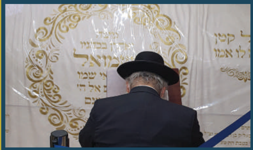
ערך שם הקפות במשך כשלושים שנה. הרב שופך את צקון ליבו בקבר שמואל הנביא

התקיעות של אביך, אנחנו נשארים כאן בתקיעות המיוחדות שלו.