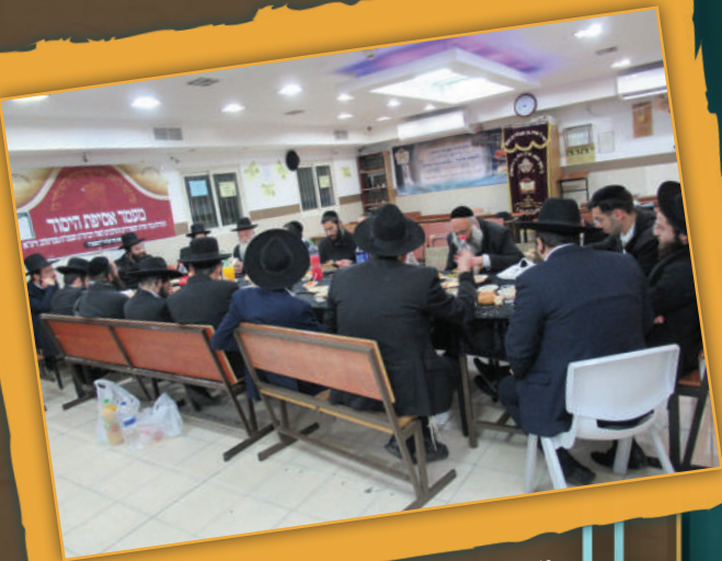
מעמד ייסוד החבורה בעיר ביתר עילית