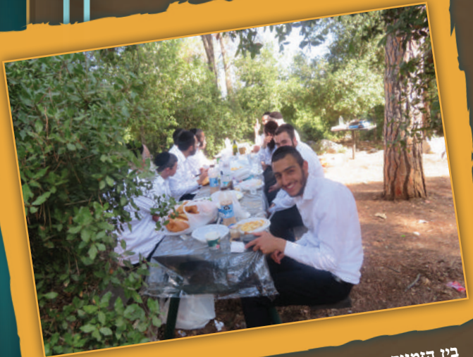
בין הזמנים אב השתפ"ד. בני חבורת אגדלך - ביתר עילית, בצוותא חרא לאחר התבודדות בשדה הסמוכה לעיר