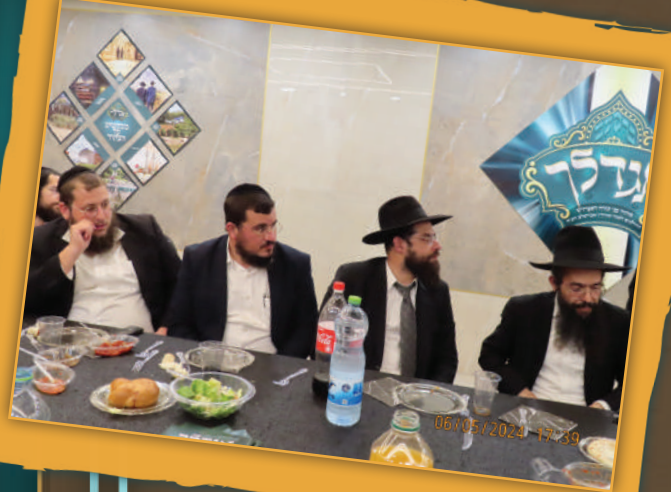
אלעד, אסיפה כללית עם כלל נציגי החבורות ברחבי הארץ

אותם אברכים, מגיעים בשלב מסוים למין צומת דרכים גורלית. מצד אחד הם כבר מרגישים טעם אחר וחדש בעבודת ה', וממילא לא חשים "בין שוים" בתוך הציבור הספרדי התורני ממנו באו, ומצד שני - הקהילה הברסלבאית עדיין רחוקה להם. המנטליות, הסגנון החסידי, ההברה והמנהגים -