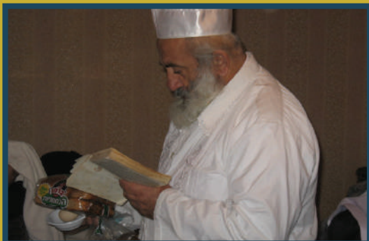
בהכנת עירובי תבשילין בערב ראש השנה שחל קודם השבת. בדירתו באומן

היו בו את כל המעלות הנצרכות, יודע היה לומר בצחות לשונו - דברי התעוררות נפלאים לפני התקיעות, גם ידע לתקוע במיומנות רבה - הכל היה הולך חלק לגמרי. ובעיקר היה ירא שמים ות"ח מופלג, תלמיד נאמן לרבינו הקדוש.