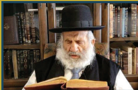
התייסר בייסורים קשים. הרב במסירת שיעור חודשים ספורים לפני פטירתו