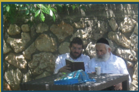
בנאות דשא. בלימוד משותף בספר הקדוש ליקוטי מוהר"ן

סבא שתק והרים עיניים למעלה בכאלו כיסופים אדירים. זה היה מחזה מרעיד. העיניים שלו הביטו כלפי מעלה בגעוע עמוק ודמעות רותחות החלו לזלוג לו על לחייו