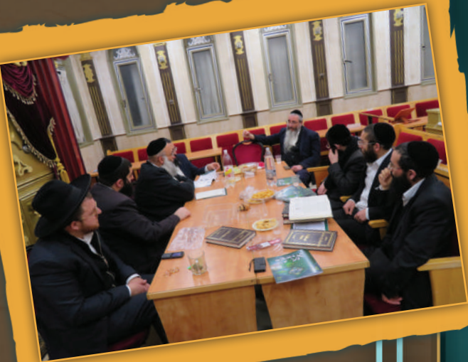
החבורה בביתר עילית