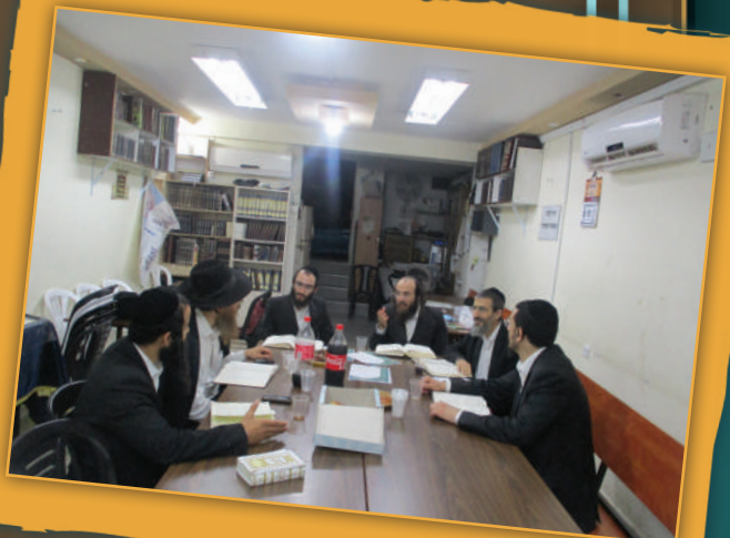
החבורה בבני ברק

הכל כדרך החסידים, מה שמקשה לעיתים רבות על הרגשת השייך.