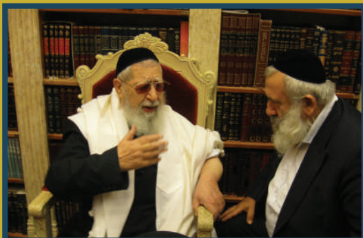
תורתך שעשועי. בסוד שיח עם מרן זצ"ל

היהודים לעיר העתיקה, חלה התחדשות בבית הכנסת 'צוף דבש' ורבי יוסף התבקש להרביץ שם תורה לעדרים.