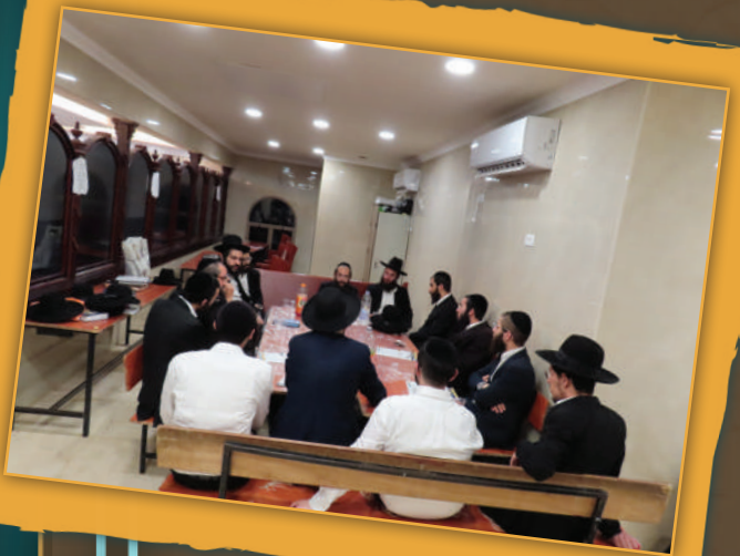
החבורה בצפת, חודש ניסן התשפ"ד,

בחור כזה וישנם מאות כאלו בכל הישיבות הספרדיות, צריך הכוונה והדרכה, אותה הוא יצליח לקבל דווקא מאדם שנראה כמוהו ועובר תהליך כמו שלו, דהיינו ספרדי בן תורה שהתקרב אף הוא לאורו של רבינו. אחד שמכיר את