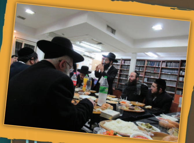
ביתר עילית. בני החבורה בדיונים