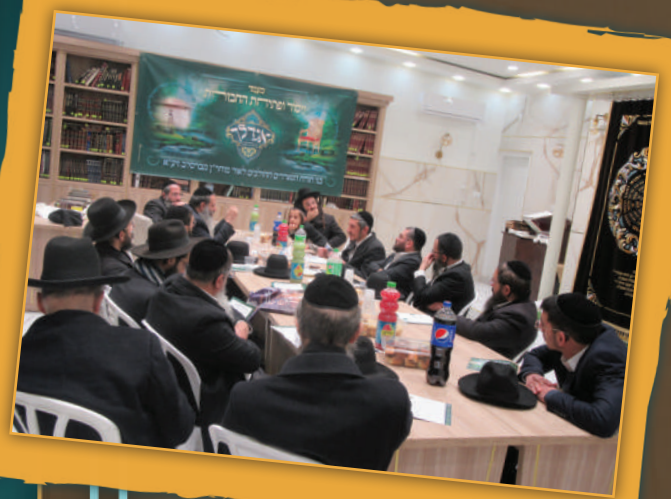
מעמד ייסוד החבורה בעיר מודיעין עילית