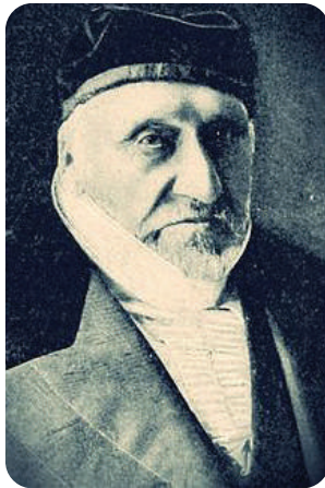
שר ר' משה מאנטיפורי

ווען דער שר ר' משה מאנטיפיורי ז"ל איז געווען ביי א באזוך אין שטאט צפת ת"ו, האט ער אפגעשטאט א באזוך אין שטוב פון ר' שמואל העליר. די ווענט פונעם צימער וואו ר' שמואל פלעגט זיין זענען געווען שווארץ פאררייכערט פון די לעכט. דער שר ר' משה האט זיך געוואונדערט אויף דעם קאליר, ער