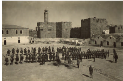
טערקישע זעלנער אין ירושלים

עס איז געווען פאר אים א זכות צו נעמען פאר זיין טאכטער דער פרויער בחור פון דייטשלאנד... אזוי ארום האט שוין ר' שלמה געקענט בלייבן וואוינען אין ירושלים ווייל דער געזעץ האט ערלויבט צו בלייבן וואוינען אין ארץ ישראל אויף אלעמאל, אויב מען האט חתונה מיט א דארטיגער בירגער.