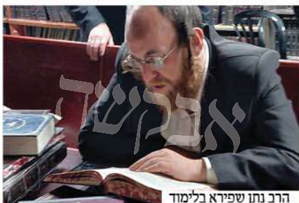
הרב נתן שפירא בלימוד