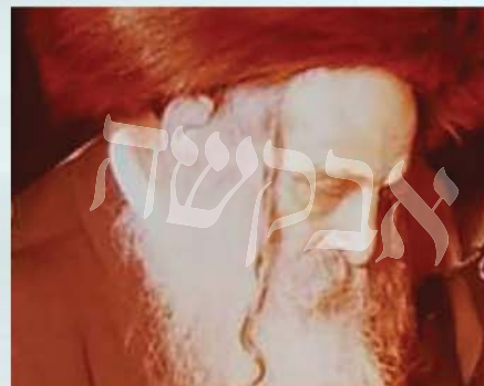
ר' יעקב מלמד